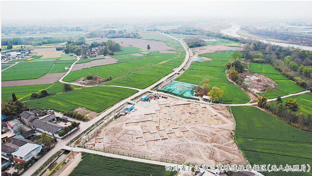
四川省广汉市三星堆遗址发掘区(无人机照片)

然而过去的考古工作和研究仍存空白。“三星堆出土玉石器原料来自哪里?制作工艺技术是什么?生产流程和流通方式是什么?这些问题都有可能通过这次的考古新发现,得到