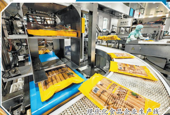
现代化食品企业生产线