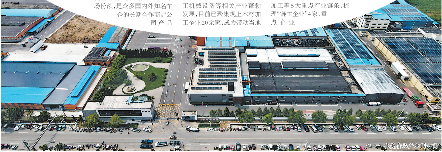
佳美食品产业园一角

“通过健全优质企业梯度培育机制,集聚各类优质资源要素,发展培育了一批绿色低碳产业链主型企业、制造业单项冠军企业和专精特新‘小巨人’企业,提升了全产业链竞争力。”牡丹区委书记尹茂林表示,全区通过持续优化产业结构,突出抓好重点领域、重点行业、重点企业的节能管理等多种举措,大力推进企业绿色低碳高质量发展,让新技术、新产业、新业态、新模式成为经济发展的重要驱动力。