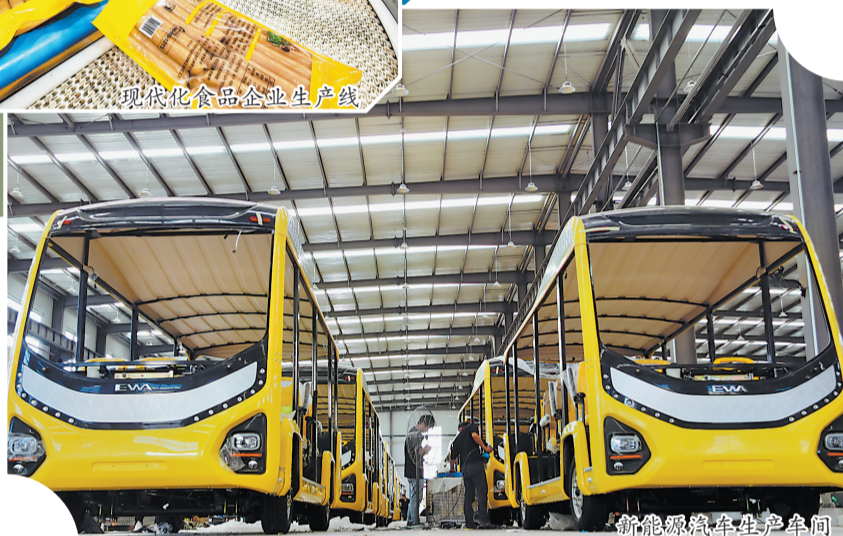
新能源汽车生产车间

记者日前获悉,落户牡丹区的华润电力始终坚持科技创新,近年来投资2亿元进行供汽、供热能力提升改造,年均节约标准煤9000吨;投资1.1亿元实施全厂废水零排放项目,每年节约用水量约230万立方,荣获2023年度亚洲能源大奖“中国地区年度最佳环保提升奖”。