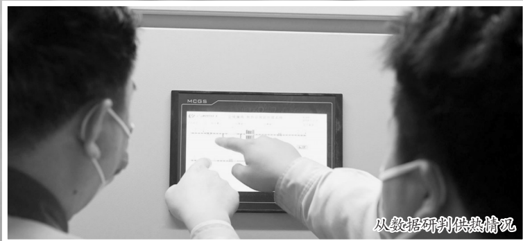
从数据研判供热情况