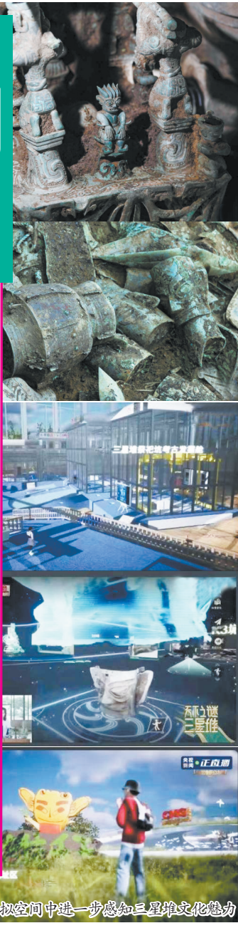
考古工作人员在三星堆遗址现场