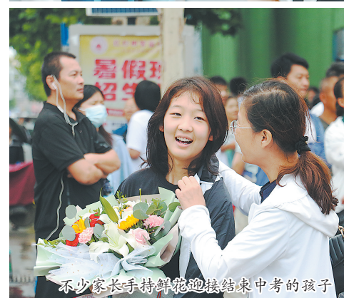
不少家长手持鲜花迎接结束中考的孩子。

本报讯(牡丹晚报全媒体记者 孟欣) 6月17日下午,随着最后一门生物科目考试结束铃声响起,菏泽市2021年中考顺利结束。中考成绩预计将于7月2日发布。