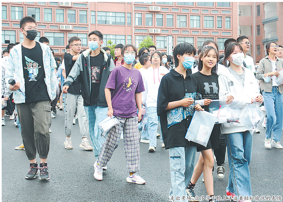
走出考场,众多学子脸上洋溢着轻松愉悦的表情。