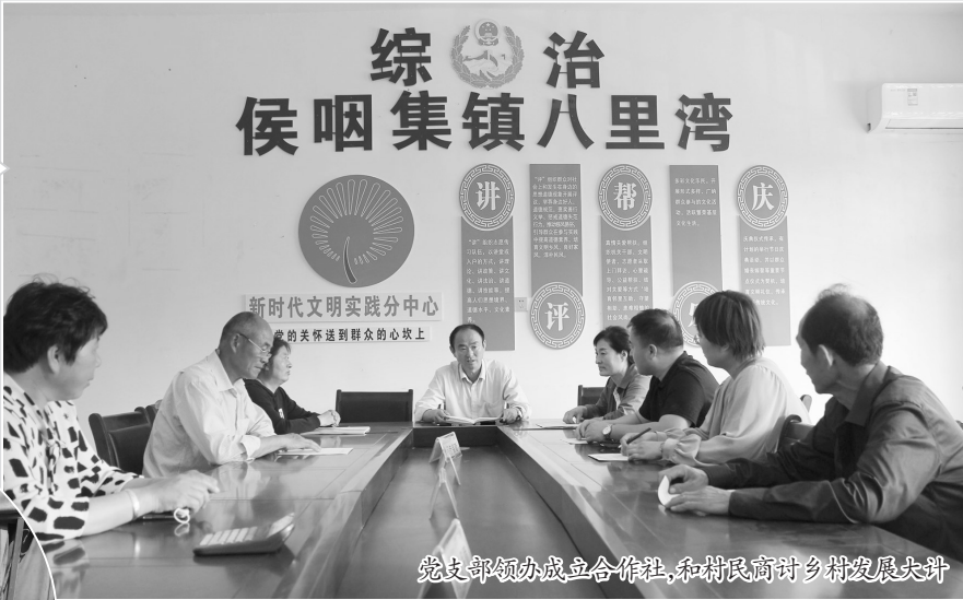
党支部领办成立合作社,和村民商讨乡村发展大计

在八里湾村的影响下,周边1500多户村民纷纷效仿,调整土地、建大棚、种蔬菜。接下来,八里湾村将按照现代农业标准要求,进一步提升示范园建设标准和产品质量,按照绿色认证标准要求规范生产管理,努力创建绿色蔬菜基地,做强做大“八里湾”蔬菜品牌。