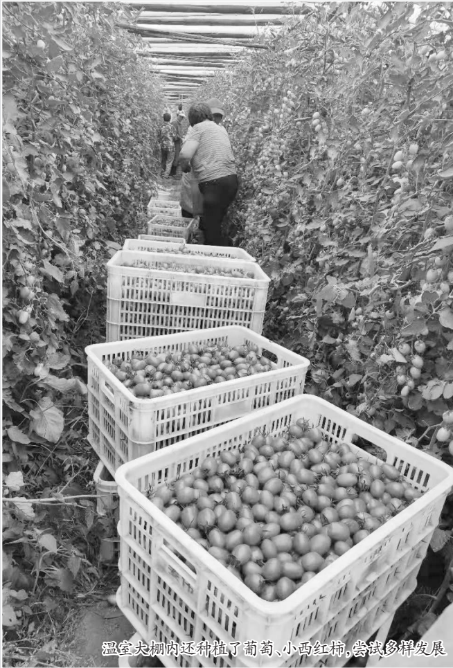
温室大棚内还种植了葡萄、小西红柿,尝试多样发展