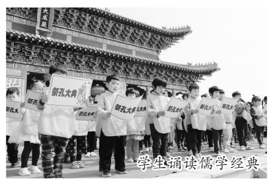
学生诵读儒学经典