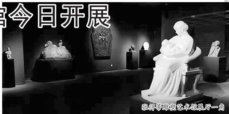
张得蒂雕塑艺术馆展厅一角

展馆地址位于市和平永昌路口市民文化中心西南侧,菏泽市美术馆内。开展后,将积极迎接广大市民前往观展。