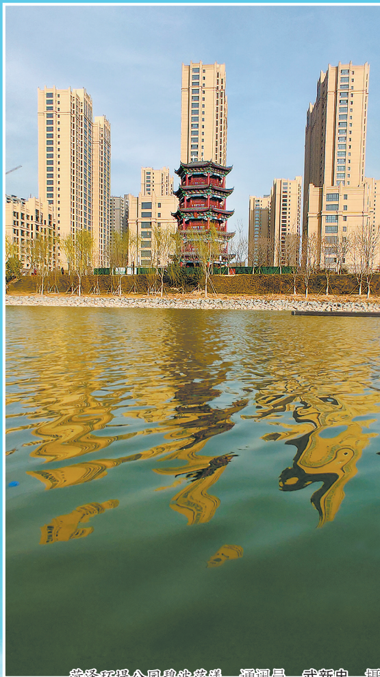
菏泽环堤公园碧波荡漾