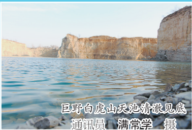
巨野白虎山天池清澈见底