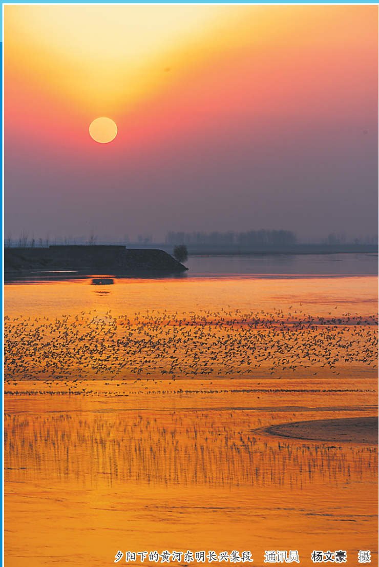
夕阳下的黄河东明长兴集段