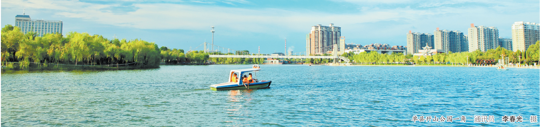
单县开山公园一角