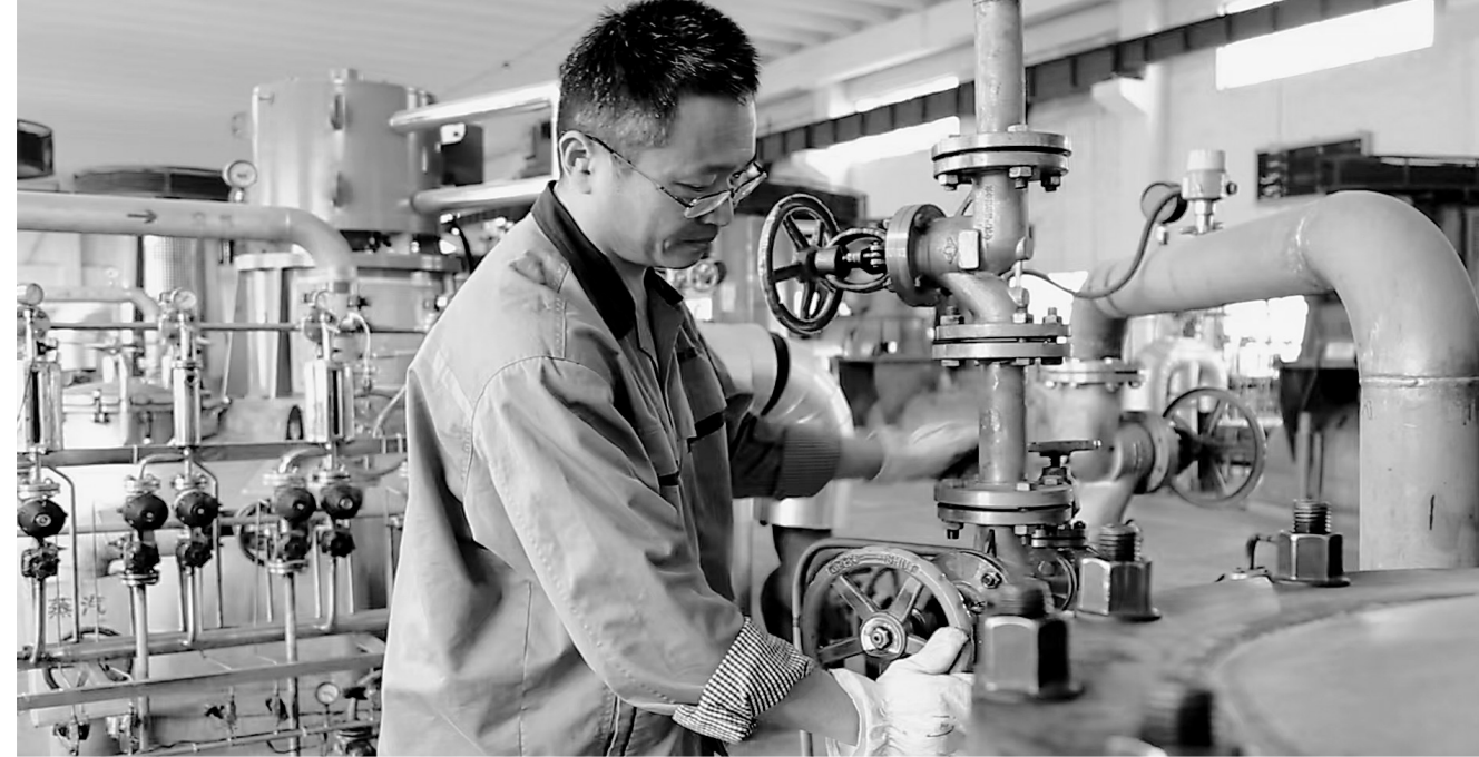
▲近日，在元元大健康产业园发酵生产车间，工作人员正紧张有序地忙碌着。该园区创新实施了“产业+人才+资金+研发”共享模式。通过“共享”理念，打破生物医药生产“一品一线”的局限，落地企业只需“拎包入住”，不需要投资建厂和组建运维团队，使药品产业化时间压缩90%，成本节约三分之二以上，实现了“研发在全球、孵化在菏泽，资源在全球、产业在菏泽”的生物医药产业聚集生态。

进行了悉心养护，更推出了70岁以上老人和现役军人等群体免费入园的优惠政策。为增强游客体验感，园区还增设了雨丝天幕、紫藤长廊、夫妻牡丹等拍照打卡点，以及全程免费的亲子乐园、网红秋千等20余项游乐设施，确保游客赏花游玩两不误。 四月的菏泽，将化身一片烂漫花海。同样，鲁西新区也处处弥漫着牡丹花香。此时的鲁西新区，不仅可以在菏泽牡丹园看到中原牡丹古树，隐匿于喧嚣中的凝香园亦是花香四溢。该园始建于宋代，又称何家花园，是中国古代北方八大名园之一。“五一”前后，园区将迎来盛花期。届时，园内姹紫嫣红的牡丹花与园区古风建设相得益彰，别有一番古韵风华，每一处角落都散发着独属于菏泽牡丹文化的迷人魅力。 除了大型牡丹园，菏泽的街头巷尾、城