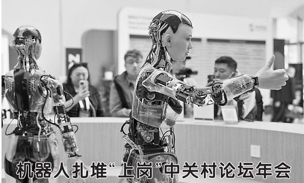
机器人扎堆“上岗”中关村论坛年会

3月27日,在中关村国际创新中心咨询台“迎宾”的机器人“妮妮”与会嘉宾互动。 当日,主题为“新质生产力与全球科技合作”的2025中关村论坛年会在北京中关村国际创新中心举行。 在本届中关村论坛年会上,近百台机器人活跃在迎宾、交流、主持、表演、服务等场景,为与会嘉宾提供服务。中关村展示中心常设展内也设置了人形机器人展区,集中展出人形机器人新技术、新产品。