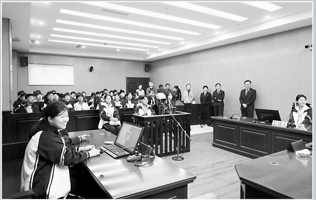
10月19日,成武县法院开展“法院开放日”活动,邀请多名人大代表、中师生走进法院,开启了一场“沉浸式”法治之旅。大家先后参观了诉讼服务中心、羁押室、法治教育基地、刑事审判庭等区域,详细了解法院审判职能、办案流程等内容。在刑事审判庭,学生们穿法袍、敲法槌,积极扮演公诉人、辩护人、书记员……在亲身参与中了解天平、法徽、法槌的意义和使用规范,也更加感受到了法庭的神圣与威严。