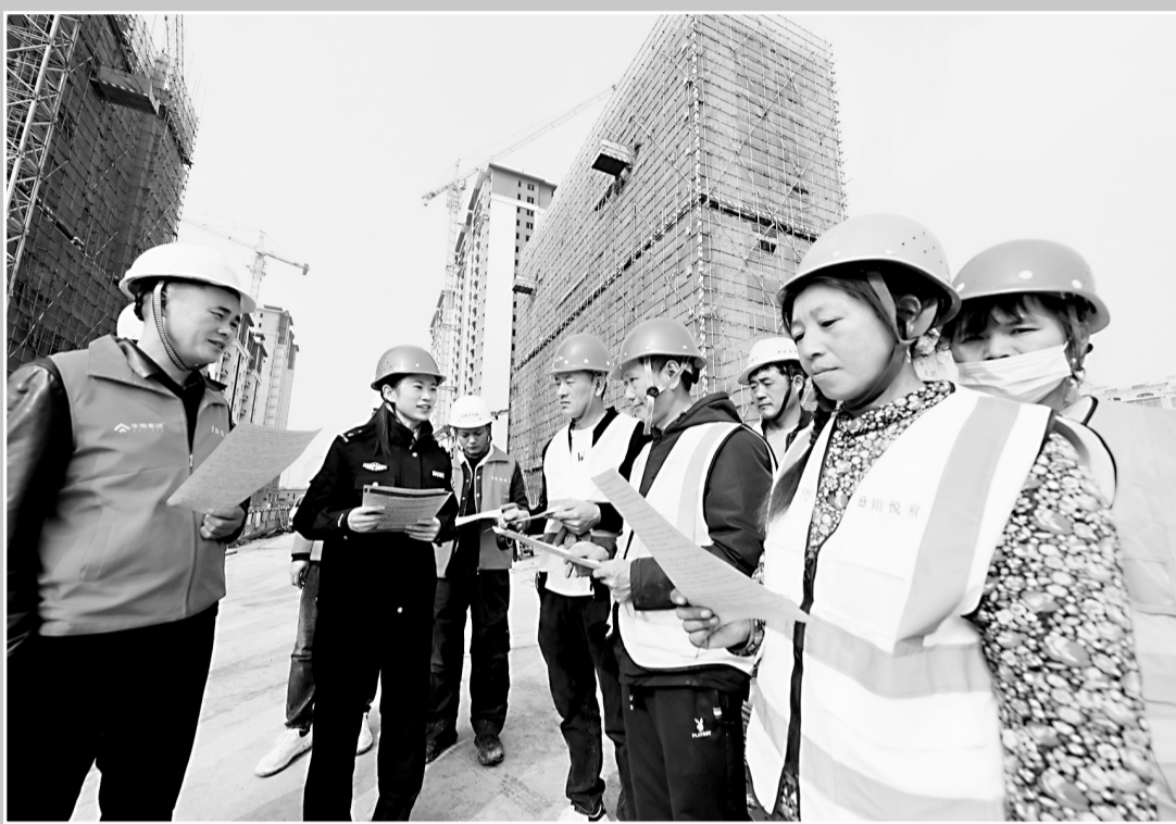
10月22日,曹县公安局曹城派出所民辅警深入辖区建筑工地,开展流动人口服务管理宣传活动,加强流动人口服务管理,同时向建筑工人宣传讲解反诈、禁毒、安全生产等法律法规。图为民警在辖区一建筑工地向建筑工人宣传相关法规。

经过调查,办案民警发现,这是一种区别于常见案例的新型诈骗手法。今年9月初,郭某、魏某二人刷短视频时,在某APP平台上找了个轻松的“发财之路”:向“客服”提供自己的微信号、个人信息,然后对方负责“挣钱”,自己可获取分红。目前,郭某、魏某已被依法处理。