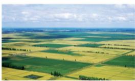
中国油用牡丹千亩示范基地