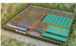
牡丹盆栽示范基地