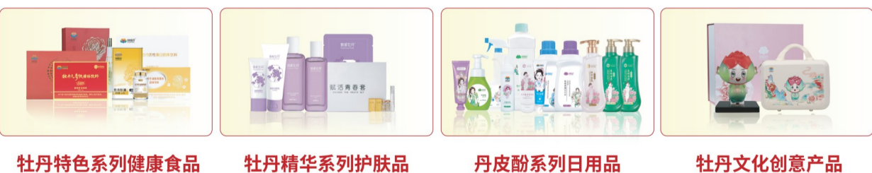
牡丹特色系列健康食品