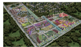
国家级牡丹种质资源库