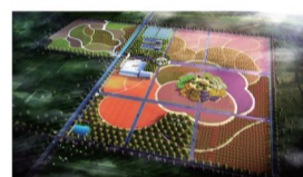
油用牡丹产学研示范基地