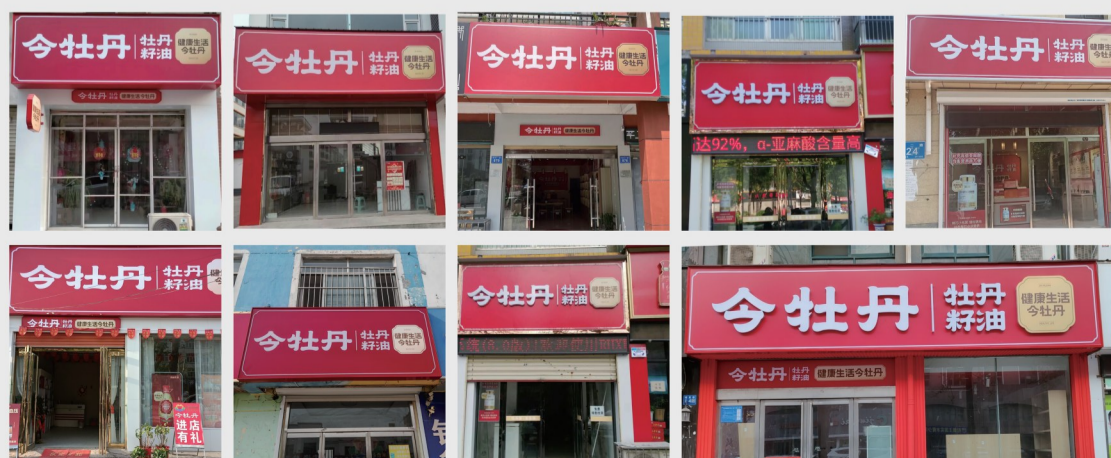
*龙池牡丹·今牡丹全国连锁加盟店部分门店展示

今牡丹连锁加盟店是龙池牡丹公司积极响应国家“一刻钟便民生活圈”的政策号召,布局全国市场的终端销售渠道,截止2024年9月,已于全国布局124个市级运营中心、506个县级运营中心、上千家门店,覆盖上千万消费者。为了更好的赋能连锁门店发展,于门店落地今牡丹驿站直播平台、今牡丹全国公益养老康养、今牡丹水站等项目,着力于通过“产品、服务、培训、动销”四个维度助推门店获取新流量、裂变新客户、提升复购率,同时不断完善线上线下消费相融合的新业态、新模式,为社区居民提供质优价廉的家庭日常生活用品和温暖贴心服务。