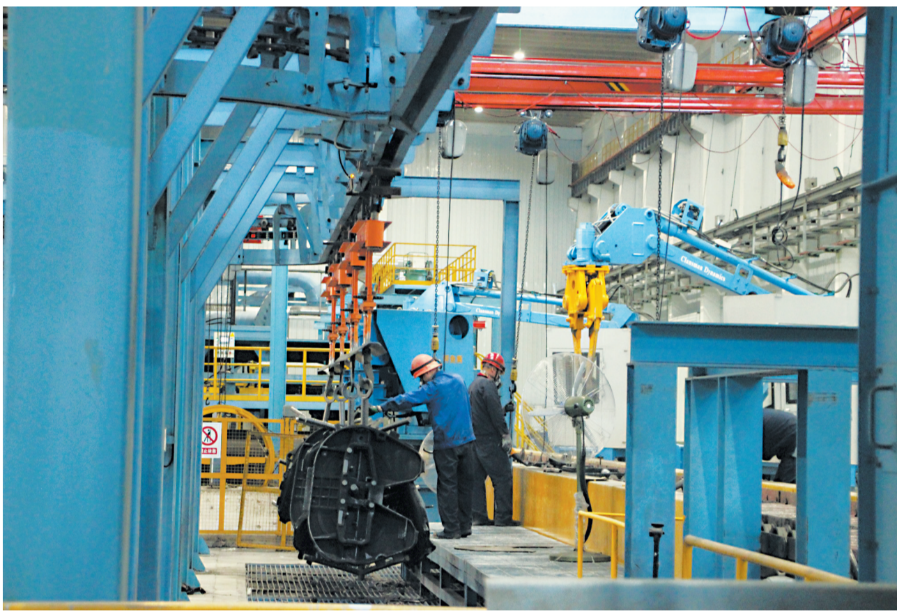
单县湖西王智能化生产技术改造项目现场,工作人员正在作业。该项目技术改造完成后,可实现智能化上下料、自动浇注、自动在线检测等,大大提高生产效率。