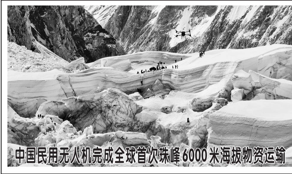
4月30日,大疆运载无人机在珠穆朗玛峰南坡昆布冰川进行物资运输测试(视频截图)。6月5日,知名无人机企业深圳市大疆创新科技有限公司宣布,该企业近期在其他机构的协助下,在珠穆朗玛峰尼泊尔一侧完成了首次民用无人机高海拔运输测试。这也是全球首次民用无人机在海拔5300米至6000米航线上的往返运输测试,创造了民用无人机最高海拔运输记录。