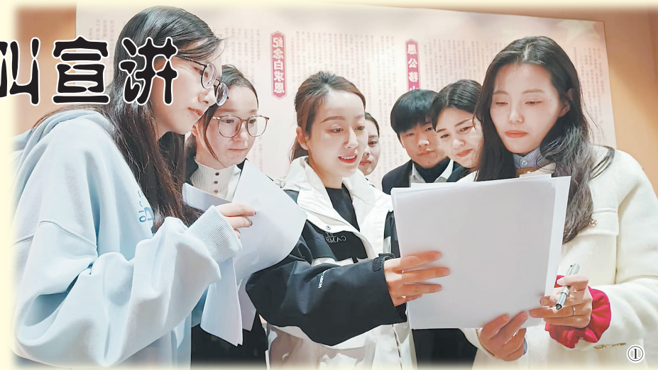
①青年宣讲员集中研讨宣讲选题

如今,单县宣讲舞台上的“夫妻档”“父子兵”“姊妹花”“兄弟帮”“师生组”等亲情友情组合还有不少,他们讲好百姓故事的同时,也在讲出自己的故事。