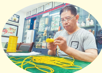
绳编的基本手法包括穿、络、缚等