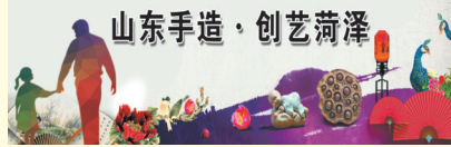
山东手造·创艺菏泽