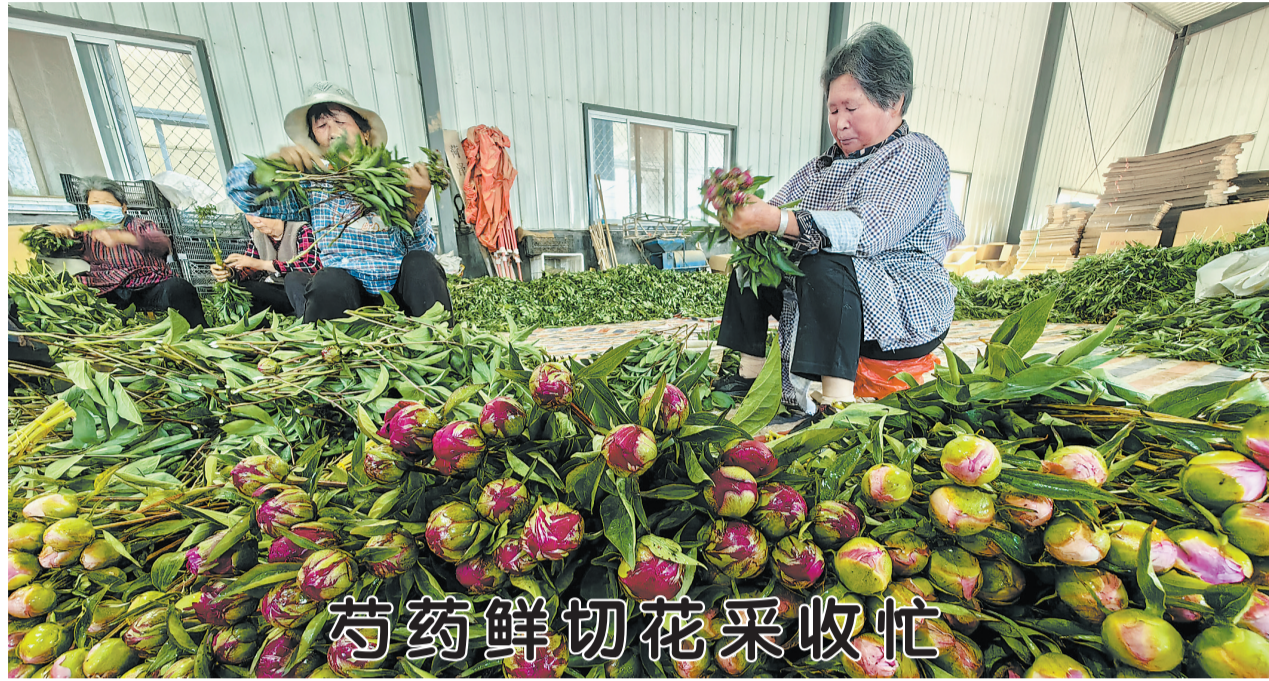
▲5月3日,村民在牡丹区皇镇街道办事处的一处芍药种植基地整理芍药鲜切花。当前,牡丹区4万多亩芍药迎来鲜切花采收旺季,花农们组织村民忙着采收、整理、包装、发货。2023年,该区芍药鲜切花销量突破1亿枝,畅销20多个国家和地区,带动当地2万余名村民就业增收。