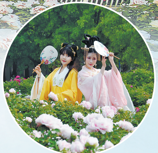
牡丹盛开吸引“牡丹仙子”流连花丛

牡丹是盛世繁荣之花,寓意和平与发展的美好愿景。中国自古有“盛世赏牡丹”之说,“花开盛世”寄托着人们对国家繁荣昌盛,对世界和平发展的美好心愿。今天的中国,经济繁荣、科技发达、文化昌盛、人民幸福,我们比历史上任何时期都更接近中华