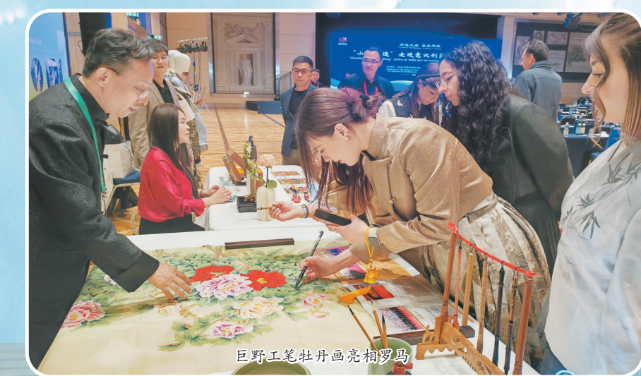
巨野工笔牡丹画亮相罗马