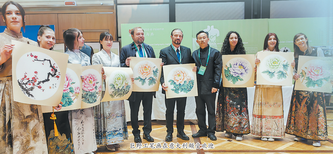
巨野工笔画在意大利颇受欢迎