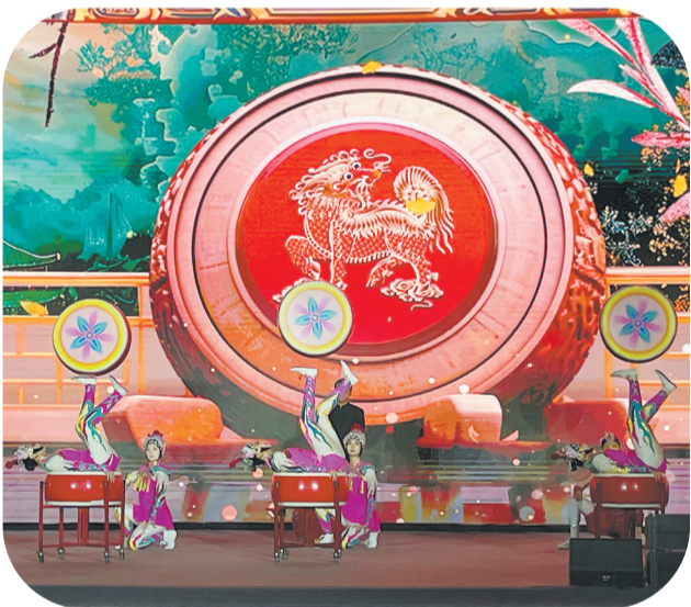
巨野杂技表演

市领导周生宏、张鹏、宋中华,省内外有关企业、协会、部门负责人,文旅领域专家学者,各县区、市有关部门主要负责同志等参加活动。