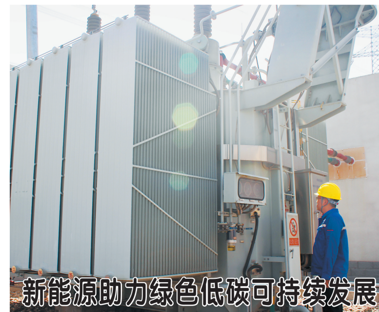
新能源助力绿色低碳可持续发展

起势映照后势,开年预示全年。准确把握高质量发展的基础、优势、机遇、态势,积极拓投资、促消费、稳外贸,着力夯实“稳”的基础,持续提升“进”的功能,我们就一定能战胜困难挑战,蕴蓄高质量发展势能,实现全年经济社会发展预期目标。