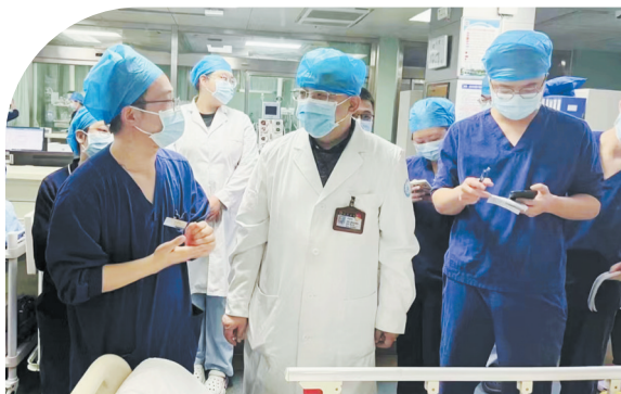
↑ 省立医院专家长期入驻 ↓