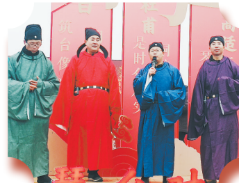
▼龙王庙大集赛诗会