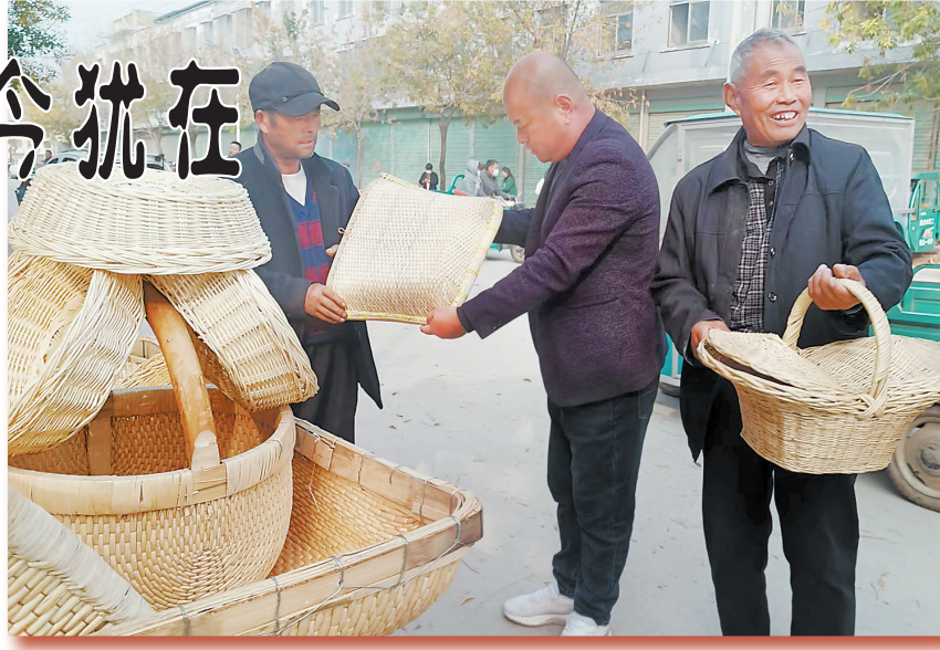
▲徐寨大集非遗展示区