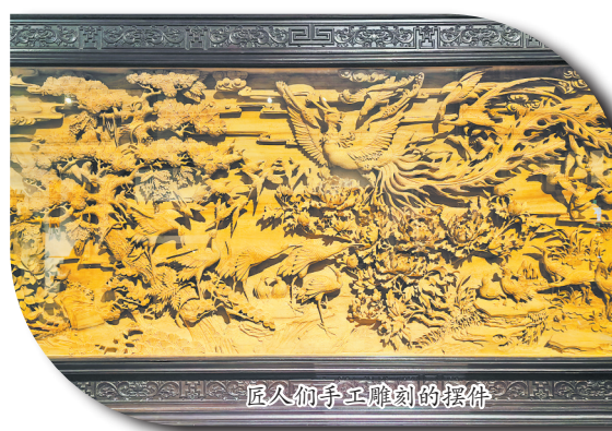
匠人们手工雕刻的摆件