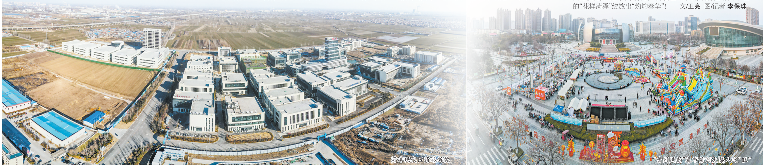
菏泽现代医药港新貌