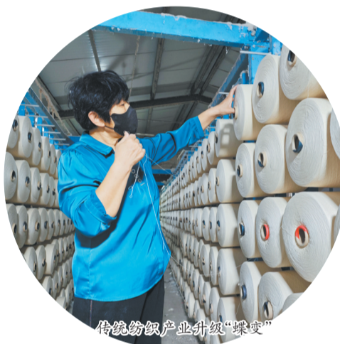
传统纺织产业升级“蝶变”