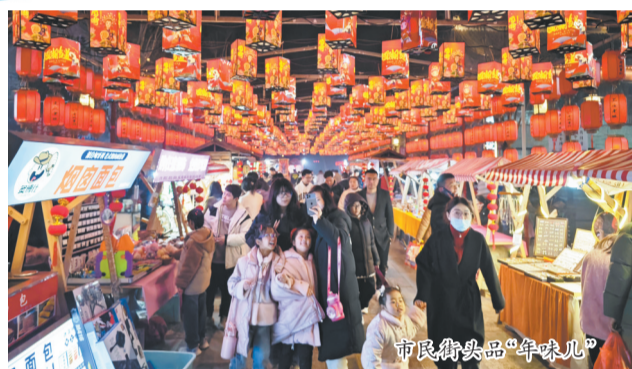
市民街头品“年味儿”