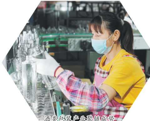
酒类包装产业链链成势