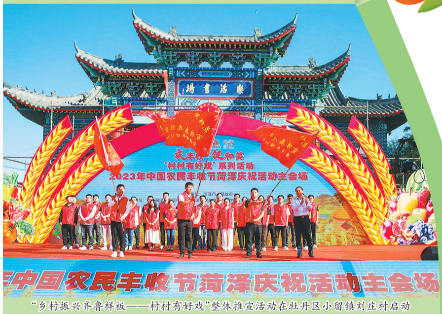
“乡村振兴齐鲁样板——村村有好戏”整体推宣活动在牡丹区小留镇刘庄村启动