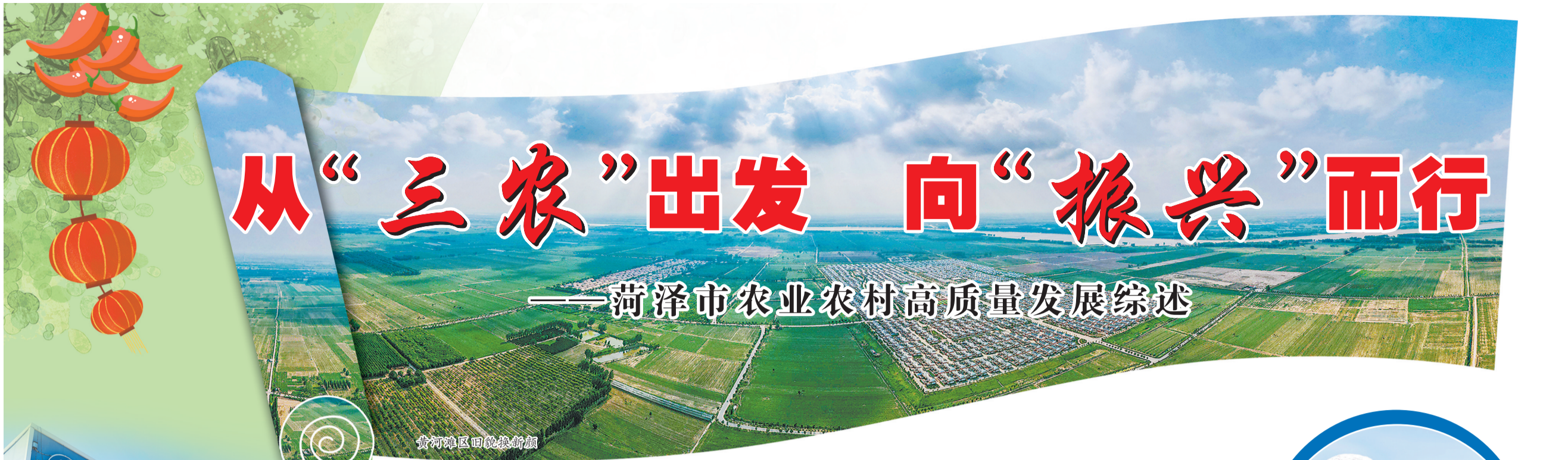
黄河滩区旧貌换新颜