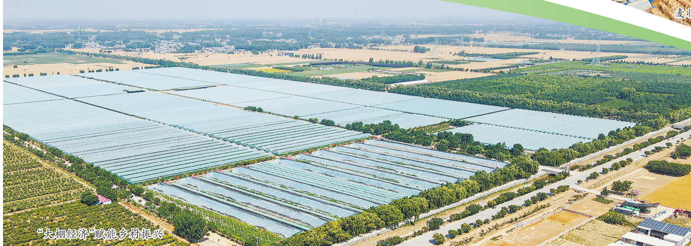
“大棚经济”赋能乡村振兴