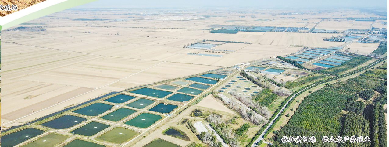
依托黄河滩 做大做强养殖业