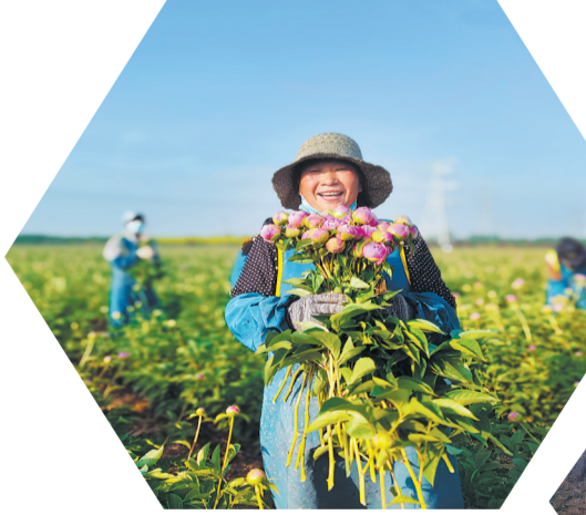
▲芍药鲜切花 ▶催花牡丹上盆

与此同时,数百万计的牡丹种苗从菏泽“开花”,到世界“飘香”。日前,在位于牡丹区黄垓镇的