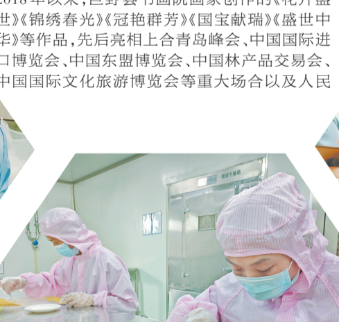
▲牡丹籽油生产线 ▶牡丹花茶茶制车间