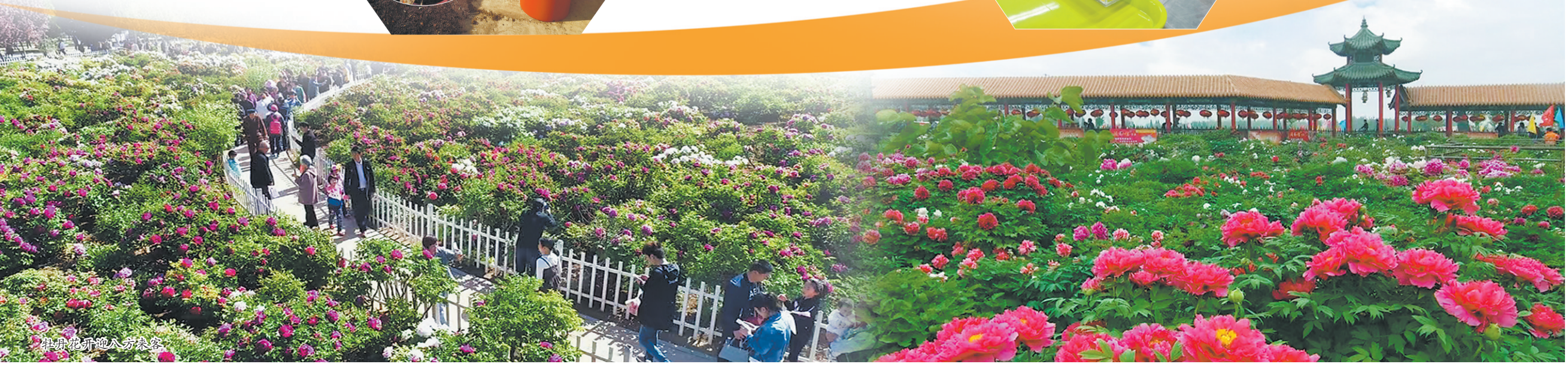
▲牡丹花游遍八方来客