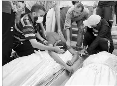
▲11月5日，在加沙地带南部城市汗尤尼斯，人们悼念在冲突中去世的亲友。