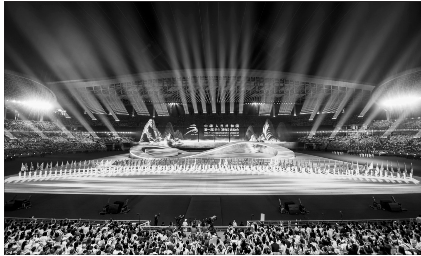
这是11月5日拍摄的开幕式现场。当日，第一届全国学生（青年）运动会在广西体育中心体育场举行。

华人民共和国第一届学生（青年）运动会开幕！全场响起热烈掌声。 随后，主题为“在青春的赛道上”的文体展演拉开帷幕。文体展演包括《青春的山河》《青春的接力》《青春的奔跑》三个篇章和尾声《青春万岁》，将运动项目、体教元素、文艺元素与广西壮美山水、多彩民族、红色文化、开放发展等元素有机结合。尾声把绿色低碳的点火仪式与表演融合，并推出原创主题歌《以青春的名义》。 学青会由全国青年运动会和全国学生运动会合并举办，是深化体教融合的重要举措。本届学青会共设39个大项、805个小项，报名参赛运动员近1.8万人。