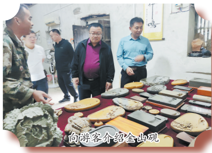
向游客介绍金山砚