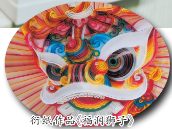
衍纸作品《福润狮子》