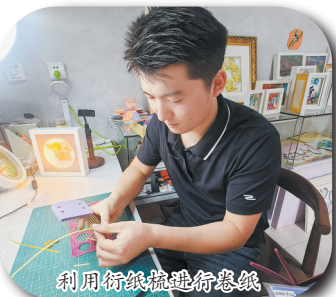
利用衍纸粘贴衍纸线