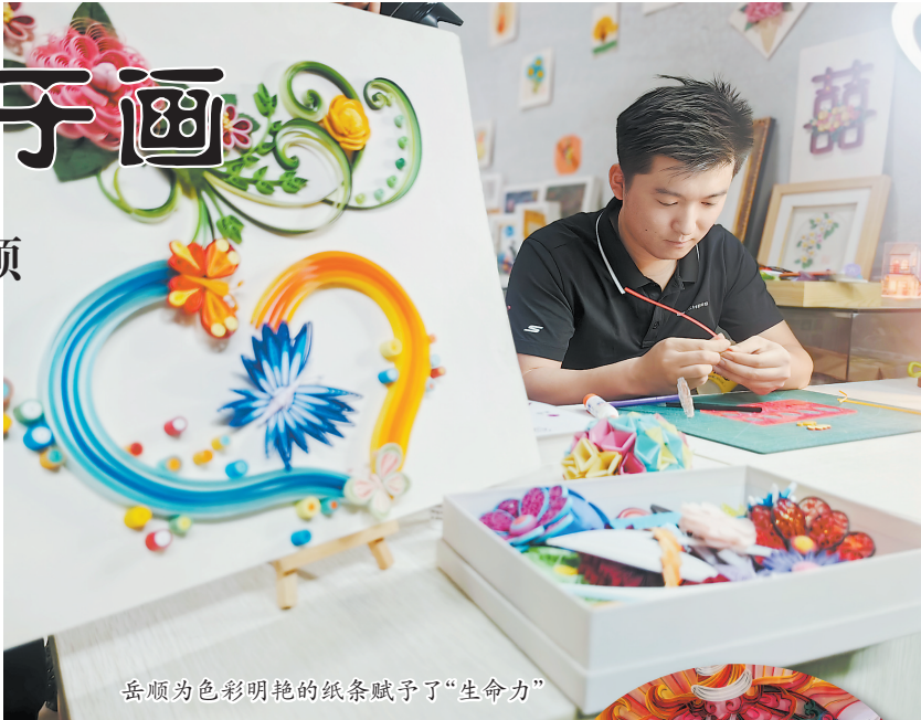
岳顺为色彩明艳的纸条赋予了“生命力”