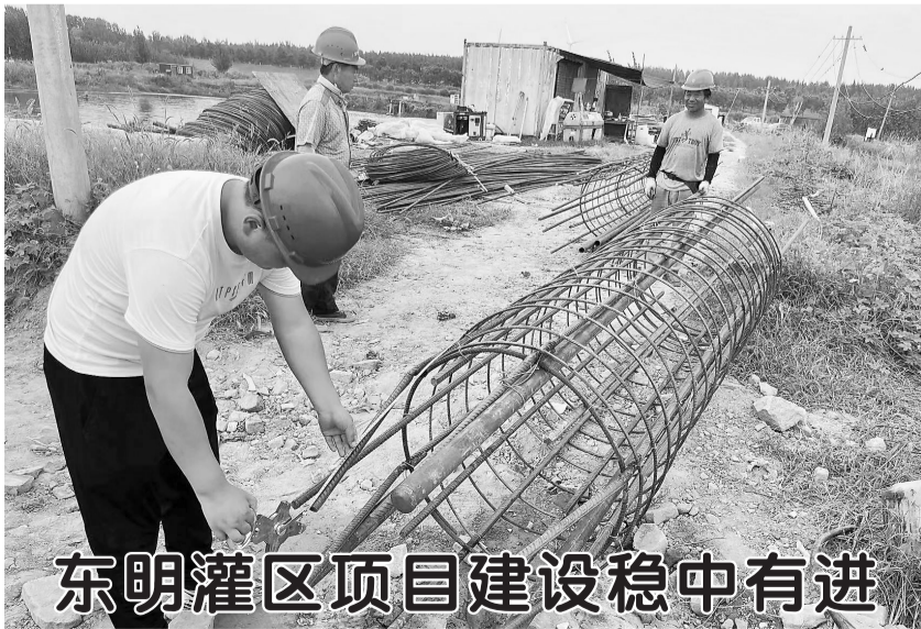
东明灌区项目建设稳中有进

本报讯(记者 张啸)为进一步加强道路交通安全管控,按照公安部交管局关于开展第二次“华东中南片区夏季交通安全整治行动”的部署安排,9月4日至13日,我市交警部门持续开展区域会战工作,全力稳定道路交通安全形势。 行动中,交警部门根据辖区流量变化、交通事故和违法查处等情况,认真分析交通违法行为和事故规律特点,围绕重点路段、时段科学布警,采取固定执勤和流动巡逻相结合的勤务模式,缜密布控,形成严查严管严处的高压态势。 交警部门提醒,货运企业应落实安全主体责任,加强对源头的监管,避免货车超载;对货运车辆驾驶人定期组织教育培训,增强安全意识,杜绝超限超载行驶;货车驾驶人不能为了眼前利益超载运输,而将自己和他人的生命危险抛之脑后;轿车驾驶人、非机动车驾驶人以及行人遇到货车,一定要与其保持一定的安全距离,防止突发状况。广大驾驶人应自觉遵守道路交通安全法律法规,共同营造安全、有序、畅通的道路交通环境。