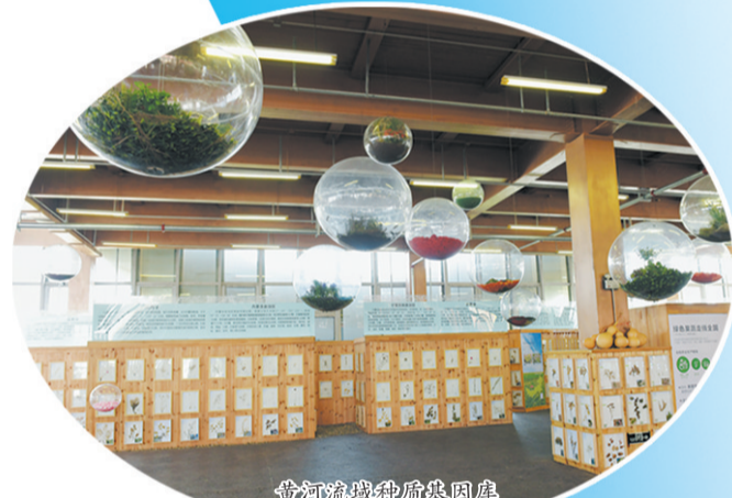
黄河流域种质基因库