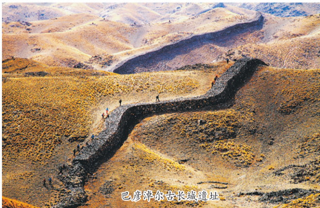
巴彦淖尔古长城遗址