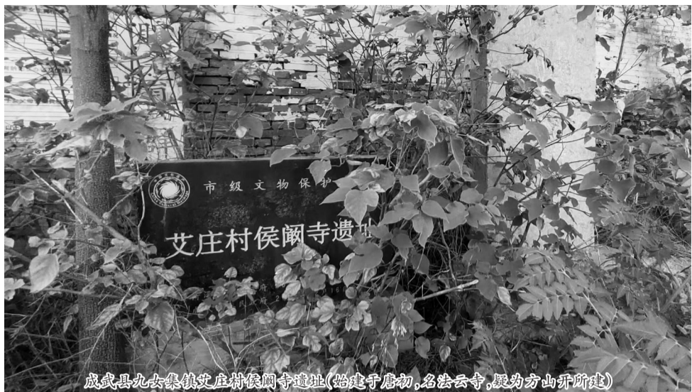
成武县九女集镇艾庄村侯闾寺遗址(始建于唐初,名法云寺,疑为方山开改悔)

笔记小说出现在我国的魏晋时期,它篇幅短小,包罗万象,用如今的话来说,就是古代的“段子”,因阅读起来省时省力,所以,受到了很多人的喜爱。据了解,我国古代的笔记小说大约有3000多种。菏泽古称曹州,在这片古老的土地上,诞生了不少著名的历史人物,发生过不少历史故事和人物轶事,有的虽然只是些小事,或者只是些奇闻怪谈,但也让人在茶余饭后有了许多助兴的谈资。这些轶事被时人记录下来,可以让现在的人们一窥当时的社会风情画卷。