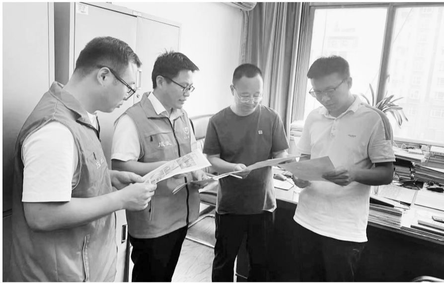
目前,成武县委政法委深入贯彻党的二十大精神,围绕“推动绿色低碳发展”,突出节约型机关创建、反食品浪费、生活垃圾分类等多项内容,充分利用“全国公共机构节能宣传周”的时机,扎实开展“四项活动”,推进节约型机关创建工作。

扩大,经营主体不断增多,下一步,成武县将以“示范村镇”为重要载体,积极引入新的要素,引导“示范村镇”加强品牌培育、发展新兴业态,拓展农业多种功能,延长产业链价值链,实现一二三产业深度融合,积极为“示范村镇”营造良好的发展环境,将“示范村镇”打造成“一村一品”提档升级的样板,示范引领全县现代农业持续健康发展。 “白浮图镇的芸豆,田集镇的蒜,张楼镇的黄瓜随着市场转;孙寺镇的木业,九女集镇的菜,党集镇的海棠迈进新时代……”这段顺口溜,真实道出了成武县发展“一镇一业”“一村一品”给老百姓带来的喜悦。