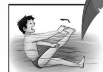
腿抽筋及时呼救并上岸