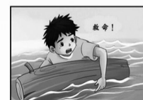
不放弃任何求生机会