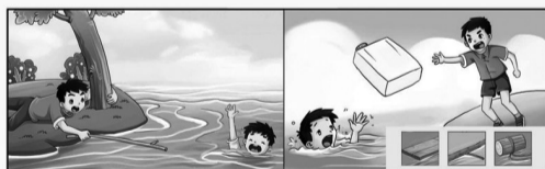
未成年人勿下水 呼救报警是首选