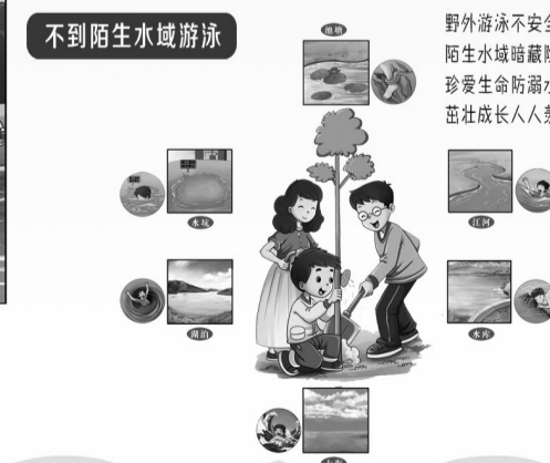
不到陌生水域游泳