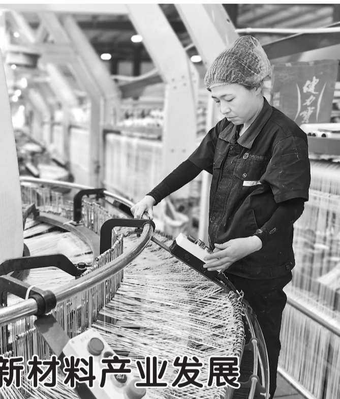
加快新材料产业发展

5月21日,位于东明县刘楼镇的一家新材料科技有限公司车间内,工人对圆织机塑料制品进行检测。近年来,东明县瞄准高端化工产业,着力“链”上发力,依托原料、成本、劳动力、市场等优势,大力发展新材料制造业。目前,全县共有新材料制造业企业20家。其中,拉丝吹膜企业1家,食品包装企业5家、吨包企业14家。