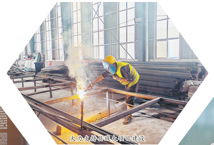
助力乡村振兴到户授信