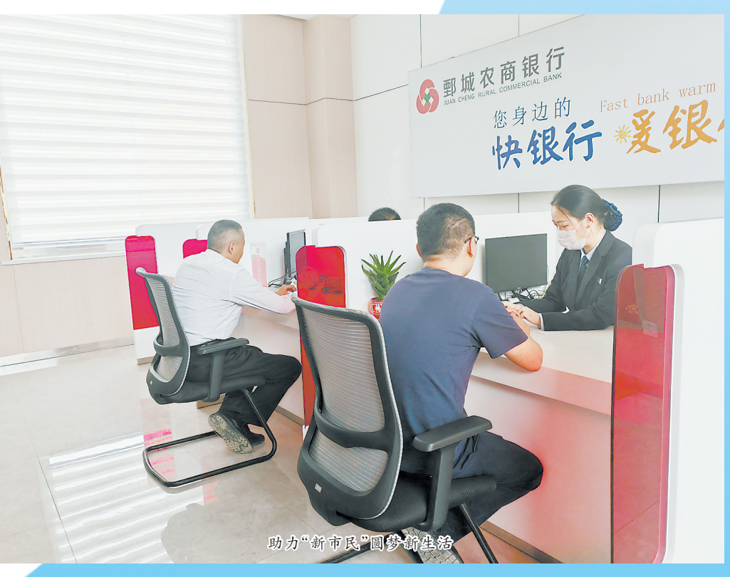
助力乡村振兴“零”上可续贷