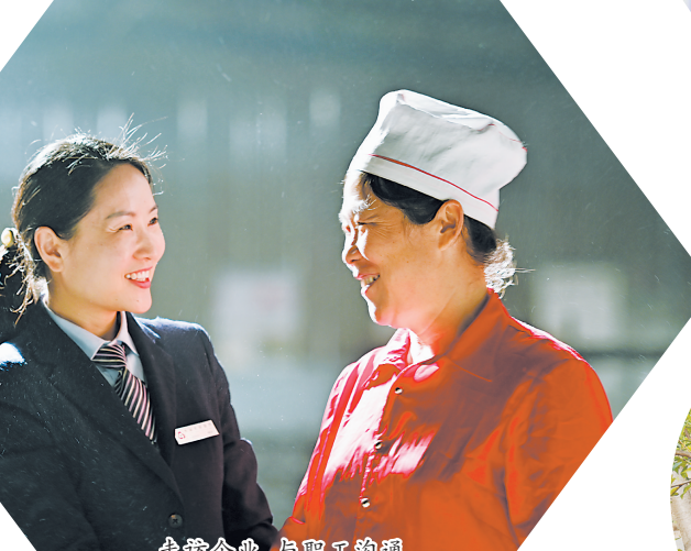
赴商企业，助力乡村振兴