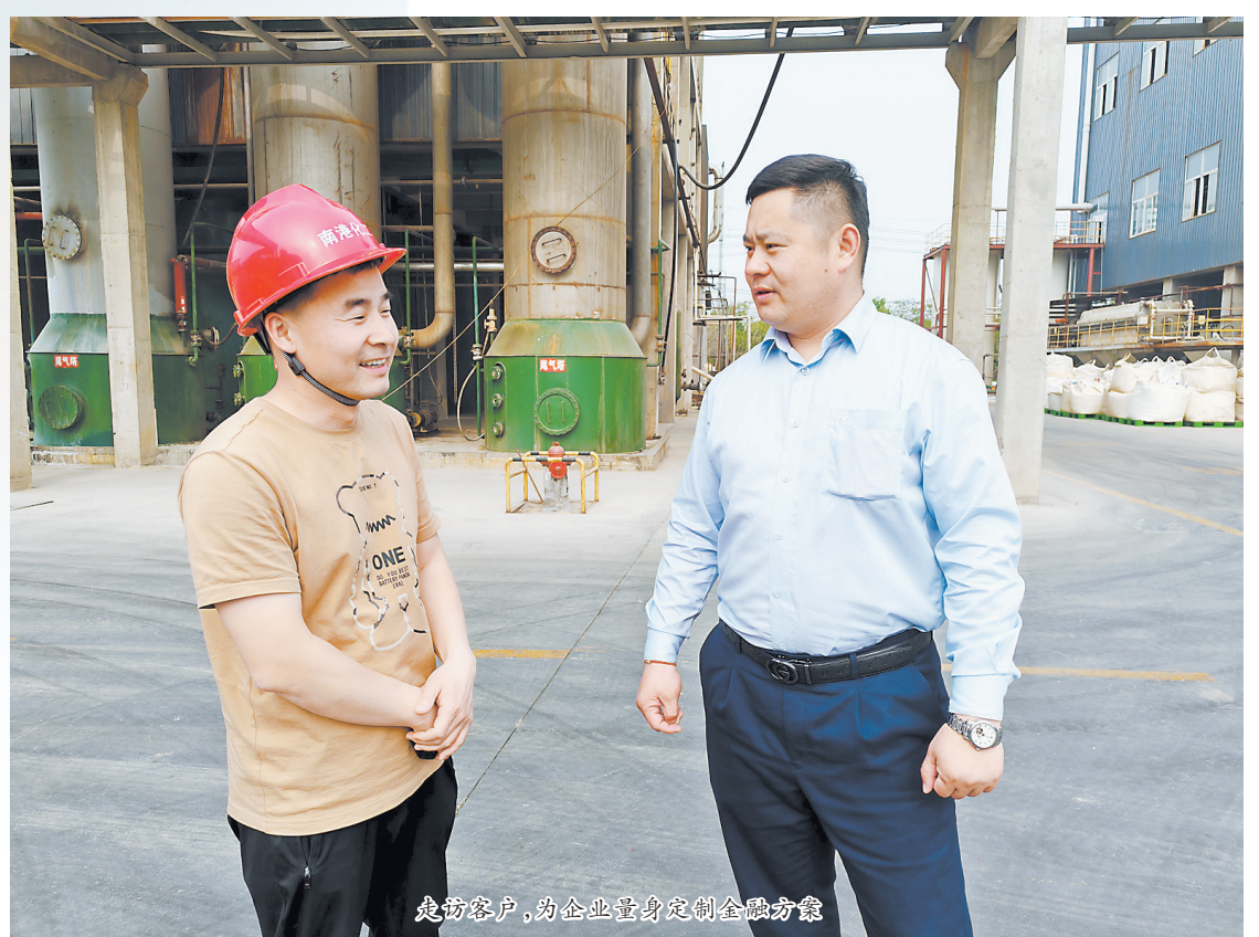
赴企业，了解企业生产经营情况