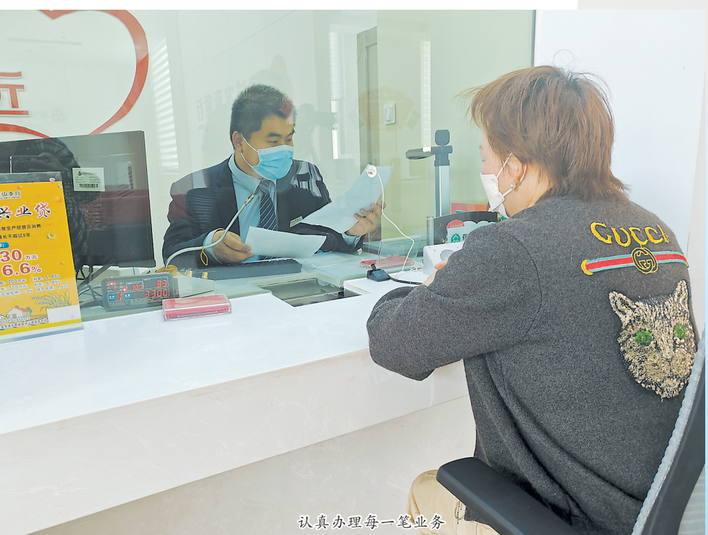
认真办理每一笔业务