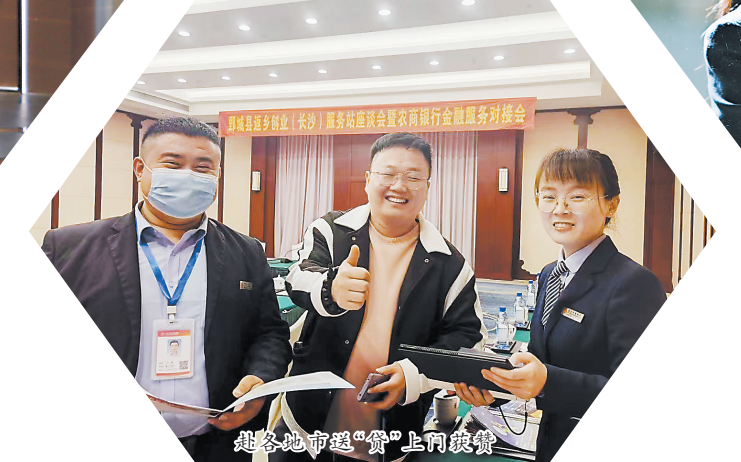
助力乡村振兴“零”上可续贷