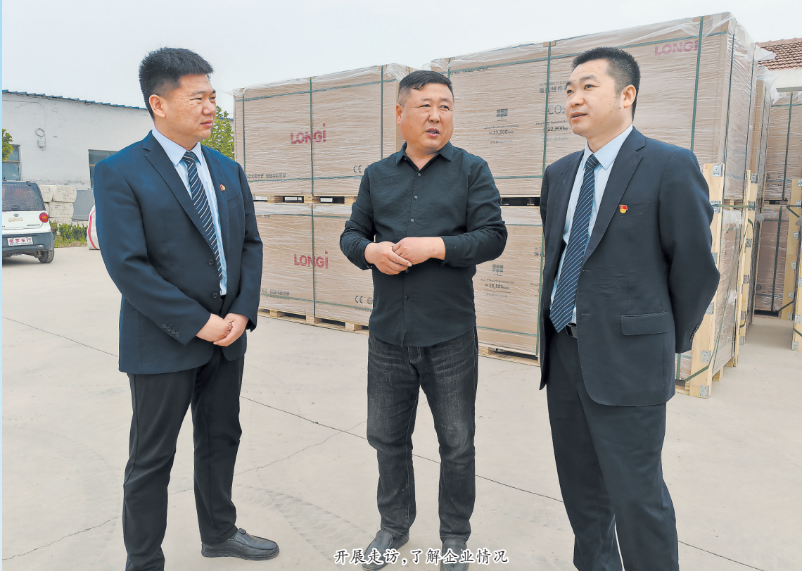
开展走访，了解客户需求