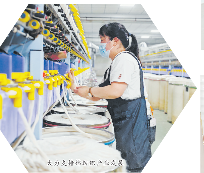
大力支持纺织产业发展