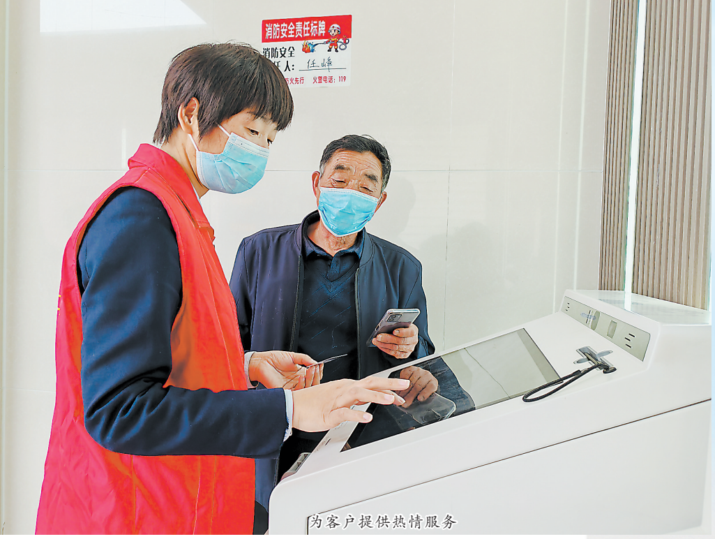
为客户提供热情服务