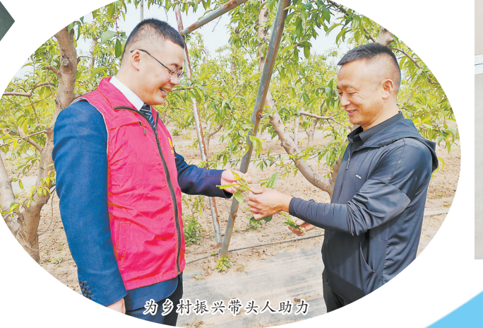
助力乡村振兴带头人助力