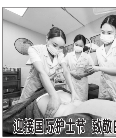
迎接国际护士节 致敬白衣天使

刘国中指出,习近平总书记非常关心关爱广大护理工作者,强调要把加强护士队伍建设作为卫生健康事业发展重要的基础工作来抓。近年来,我国护理事业发展成效显著,护士总量达520多万人,护理服务能力持续提高,为守护人民身体健康和生命安全提供了有力保障。特别是在抗击新冠疫情中,广大护理工作同仁义无反顾、不负重托,辛勤奋战在一线,为疫情防控取得重大决定性胜利作出了重要贡献,无愧“白衣天使”的光荣称号。