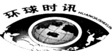
芬兰一行人天桥倒塌致27人受伤

据新华社赫尔辛基5月11日电 芬兰首都赫尔辛基以西城市埃斯波11日上午发生行人天桥倒塌事故,致27人受伤,其中多数是未成年人。赫尔辛基地区卫生部门告诉媒体,已有15人被送往医院。