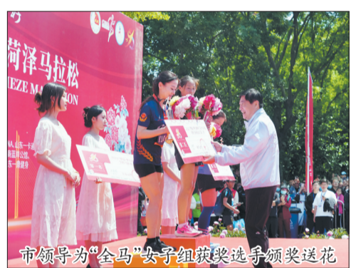
市领导为“全马”女子组获奖选手颁奖送花