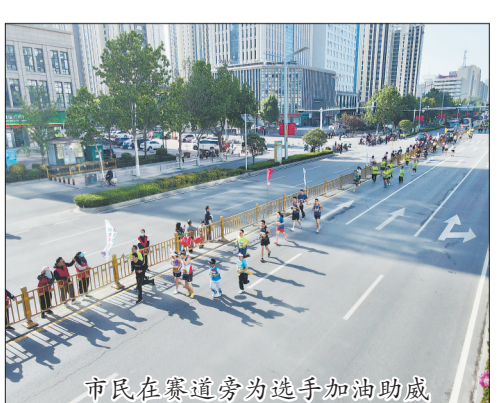
市民在赛道旁为选手加油助威