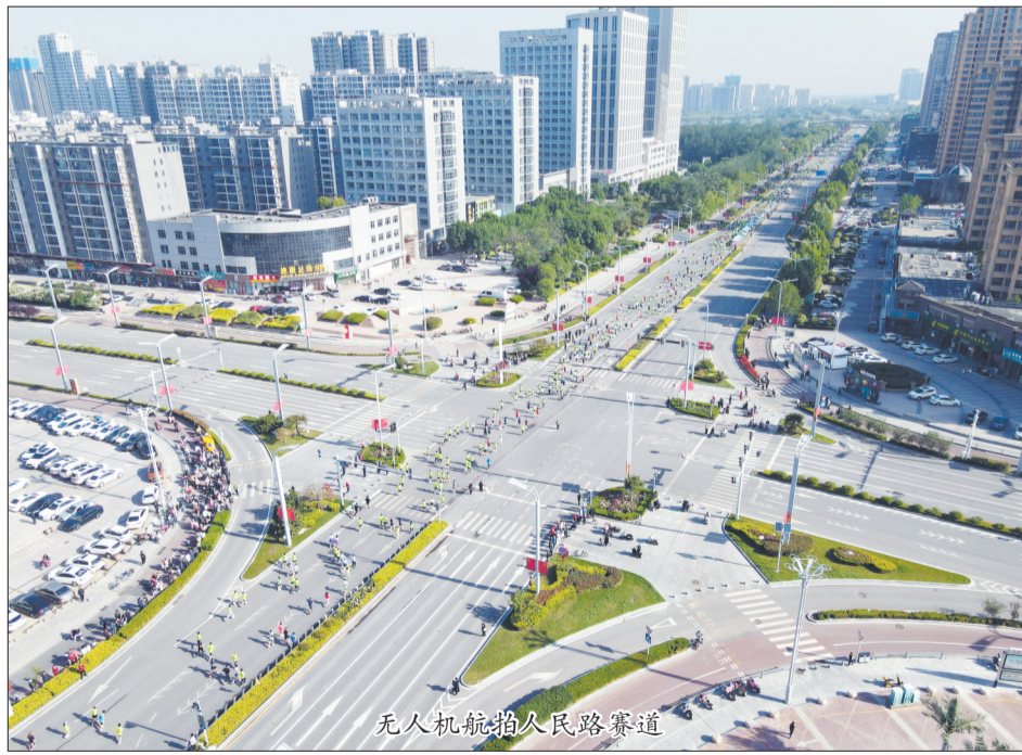
无人机航拍人民路赛道