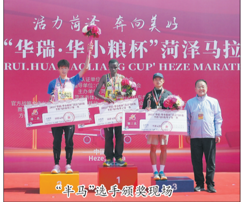
“半马”选手颁奖现场