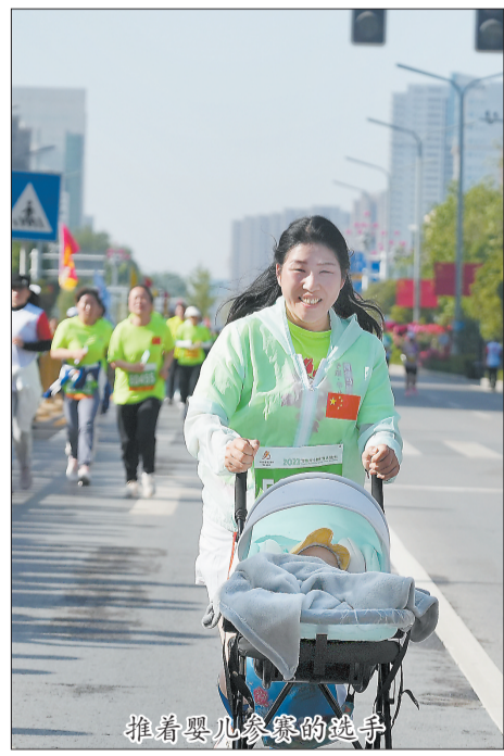
推着婴儿参赛的选手