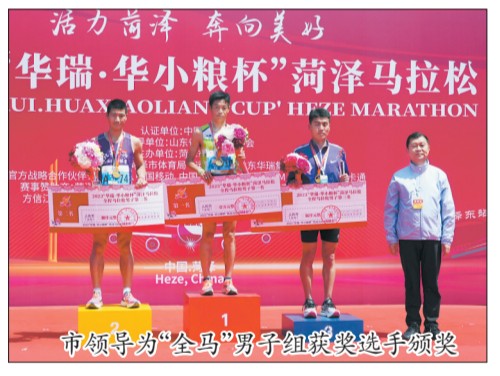
市领导为“全马”男子组获奖选手颁奖