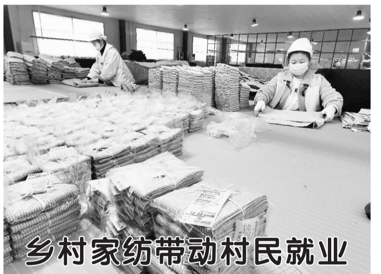
乡村家纺带动村民就业