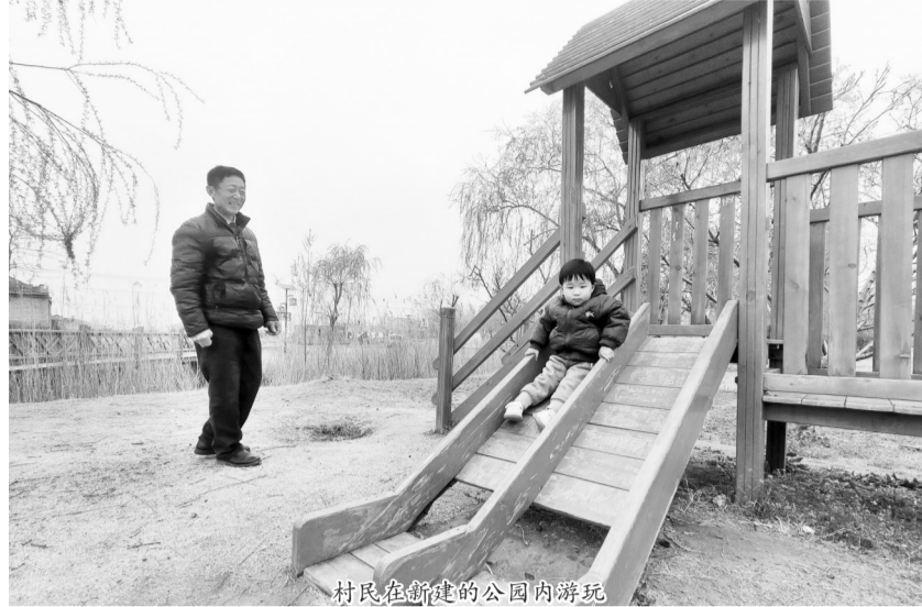
村民在新的公园内游玩

40多年前,鲁西南农村的群众就有在夜晚聚在一起“拉呱说事”的习惯。近年来,刘土城村重拾这一传统,由镇村干部组织村民利用晚饭后的时间,围绕村容村貌、村内事务,共同商量解决办法,通过“乡村夜话”推动基层难题解决和各项工作落实。