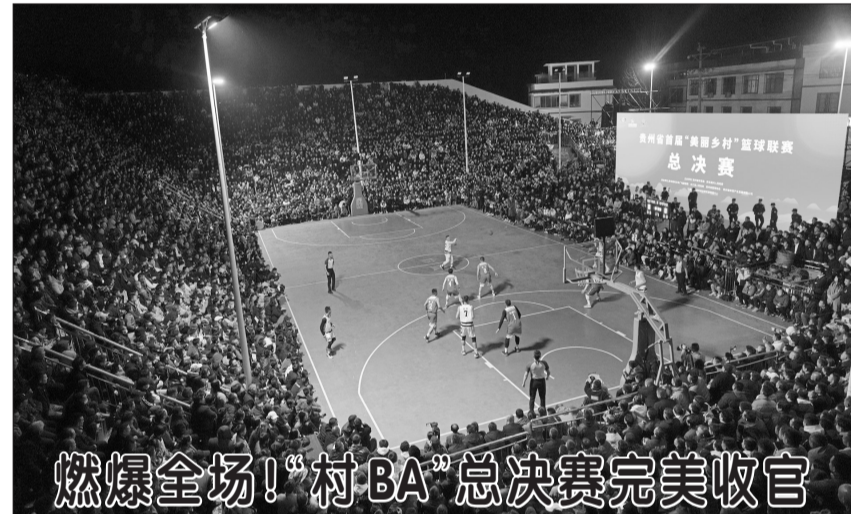
燃爆全场!“村BA”总决赛完美收官

超过2400吨的锚链牢牢拽住这个“海上摩天轮”。投产后,风机年发电量将达2200万千瓦时,所发电量通过1条5公里长的动态海缆接入海上油田群电网,用于油气生产,每年可节约燃料近1000万立方米天然气,减少二氧化碳排放2.2万吨。 康思伟说,“海油观澜号”是目前世界上最深最远,同时也是全球首个给海上油气田供电、海域环境最恶劣的半潜式深远海风电平台,在单位兆瓦投资、单位兆瓦用钢量、单台浮式风机容量等多个指标上,处于国际先进水平。