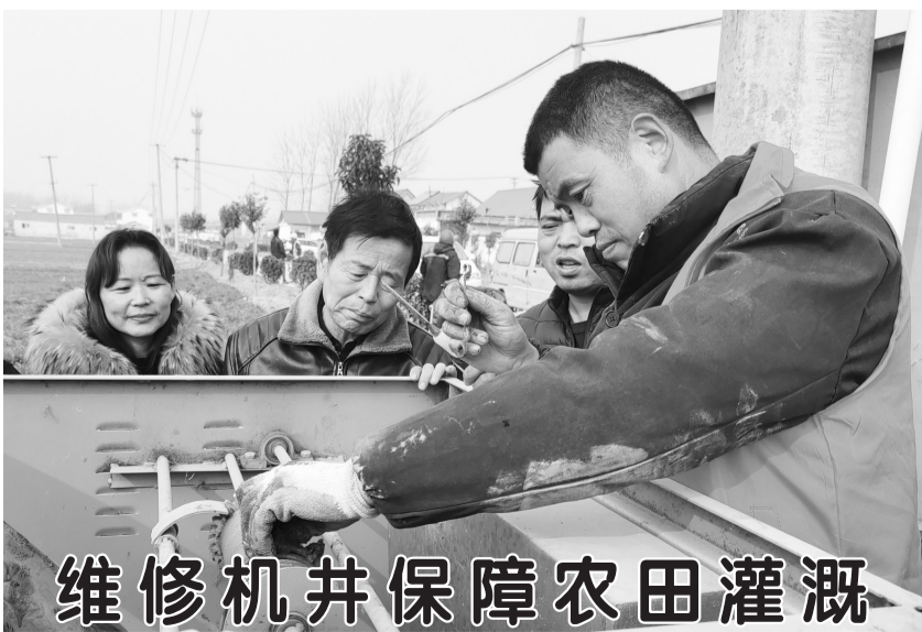
维修机井保障农田灌溉

此次修路、安地磅,不仅改善了村民的出行条件,同时也方便了村民的生产生活,村路连通了民意,地磅承载着民心,成为助力乡村振兴和提高村民生活水平的有效载体。