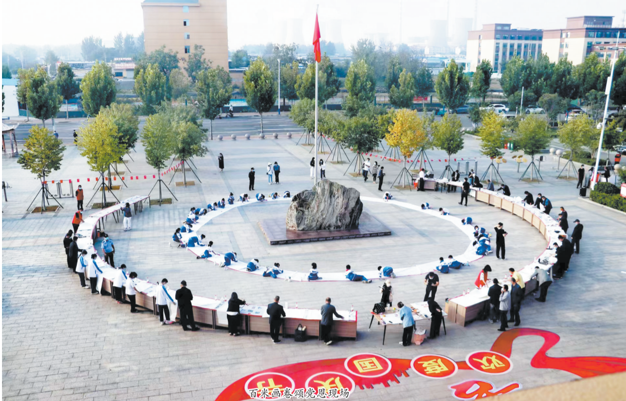
百米画卷颂党恩现场