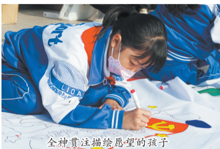
全神贯注描绘愿望的孩子