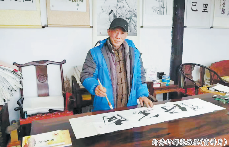
郑秀行挥毫泼墨(资料片)