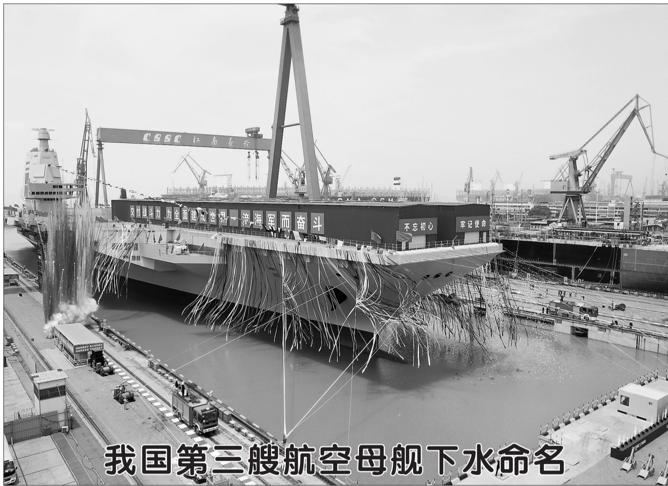
我国第三艘航空母舰下水命名

据介绍,该剧讲述了在1947年的云周西村,15岁的刘胡兰面对敌人的铡刀像一株傲雪的红梅,以大无畏的英雄气概书写“生的伟大,死的光荣”的瑰丽人生。该剧选取刘胡兰被捕到牺牲很短的一段时间为叙