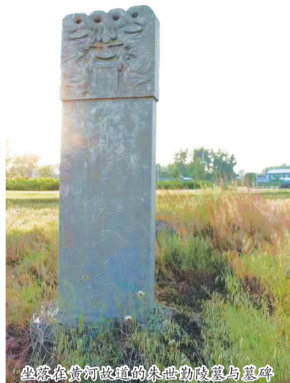
坐落在黄河故道的朱世勤陵墓与墓碑

在单县杨楼镇姜李庄村的街头,一座刻有“抗日将领朱世勤纪念碑”的石碑引人注目,令人景仰。 在姜李庄村,有关朱世勤的英雄故事,妇孺皆知,口口相传。因朱世勤是国共合作的抗日名将、民族英雄,其生于斯、长于斯的姜李庄村蜚声遐迩,彪炳史册,成为一个村的骄傲。 姜李庄村位于黄河故道,与河南、安徽两省接壤,曾是湖西抗日根据地的前沿阵地。 在姜李庄村东的一处农家老院落,居住着现年59岁的朱世勤的三子朱德奎祖孙三代人。一直以来,朱德奎悉心保存着爷爷的《恤恤给与令》和奶奶的《抚恤证》,收集整理爷爷的英雄故事,并讲给自己的子孙和