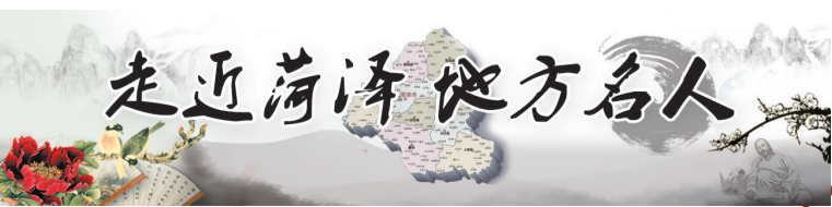
走近菏泽地方名人

燕地当了奴仆。幸而这家的主人对待栾布非常好,他也过上不愁衣食的日子。没多久时间,栾布的主人因为富有被人盯上,遭到陷害,栾布气愤不过,就替主人报了仇。这是栾布的第一次见义勇为。 为躲避追捕,他参加了燕将臧荼的军队,臧荼听说了他的事情后,觉得栾布是个忠义的人,就推荐他担任了都尉。后来,臧荼被刘邦封为了燕王,栾布也当上了将军。刘邦建汉后开始大肆除异姓王,臧荼非常害怕,于是起兵反汉。刘邦亲自带兵征伐,在杀了臧荼后,俘虏了栾布。这时候,已经成为梁王的“发小”彭越听说了栾布被俘,害怕栾布被杀,赶紧给刘邦上书,请求赎回栾布,并提出,还要让栾布担任自己封国的大夫。这让刘邦起了疑心,也给彭越埋下了定时炸弹。栾布到了梁国后,彭越让他出使齐国,还没回来,彭越就出事了。 公元前197年秋天,陈豨在代地造反,刘邦向彭越征兵。彭越推说有病,没有亲自带兵出发。这更引起了刘邦的怀疑,他觉得彭