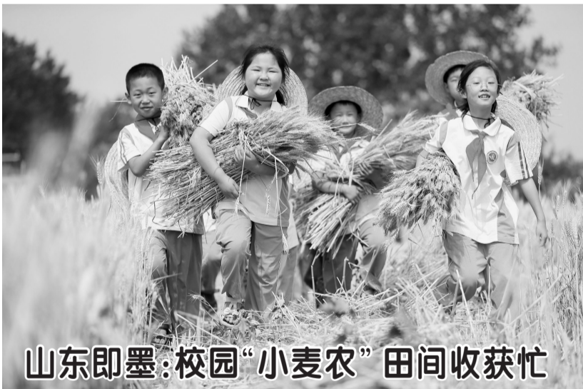
山东即墨:校园“小麦农”田间收获忙

通知要求,要优化选拔招募结构,紧贴全面实施乡村振兴战略需要,深入挖掘基层事业发展急需紧缺岗位。持续强化培养使用,继续实施能力提升专项计划,中央财政支持开展专项培训8000人次,提升服务保障水平,加大资金支持力度,按月足额发放工作生活补贴。促进服务期满流动,拓宽基层留人、用人渠道,鼓励服务期满人员扎根基层、成长成才。