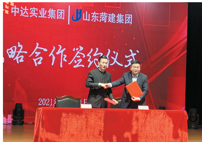
近日,山东中达实业集团与山东建信集团战略合作签约仪式举行。双方将围绕中达尚城学府、中达尚城一品两个开发建设项目展开战略合作,为项目的创新发展注入新活力,实现共赢。在签约仪式现场,双方对公司主营业务、经营优势进行了详细介绍,并针对战略合作事项进行了交流,表达了对于合作前景的殷切期望。

目前,万达住宅区、商业区已有6000余户交房入住,10#、11#楼将于今年交付,以万达为核心的地标性建筑群已实景呈现,与城市共发展。 天安建信集团坚持以菏泽万达广场开发为原点,实施东西两翼齐飞的发展战略,将在菏泽开发区、高新区斥资百亿打造全新的文、商、旅融合的第四代万达广场综合体,从场景创新、科技创新、内容创新三大方面迭代升级,为消费者提供沉浸式消费体验,打造新的商业高地。届时,菏泽城区未来将有三座万达广场,在进一步丰富菏泽市民的物质文化生活基础上,在完善城市功能、提升城市品位、带动城市商业繁荣和经济发展方面,具有重大战略意义。