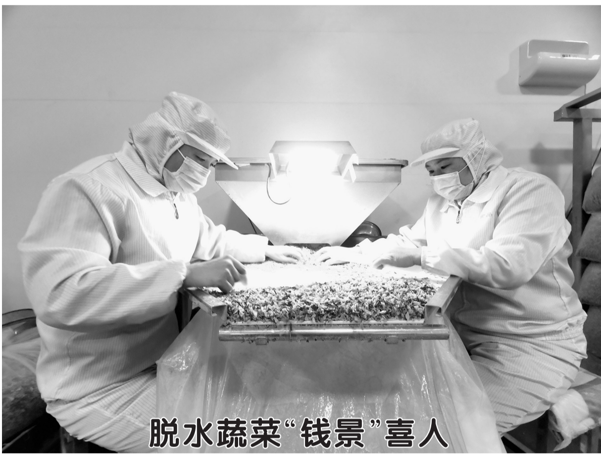
脱水蔬菜“钱景”喜人

12月16日,位于牡丹区沙土镇的裕华食品公司蔬菜深加工车间内,工人正在分拣脱水蔬菜半成品。据悉,裕华食品是一家以加工脱水蔬菜为主的农业深加工龙头企业,拥有国内先进的AD脱水生产线,公司采取“公司+合作社+基地+农户”的发展模式,由公司提供种子、技术、肥料,农户种植的高丽菜、红萝卜、青葱等蔬菜全部保底回收,农户每亩可增加收益2000元左右。