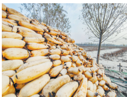
刚采挖上来的莲藕