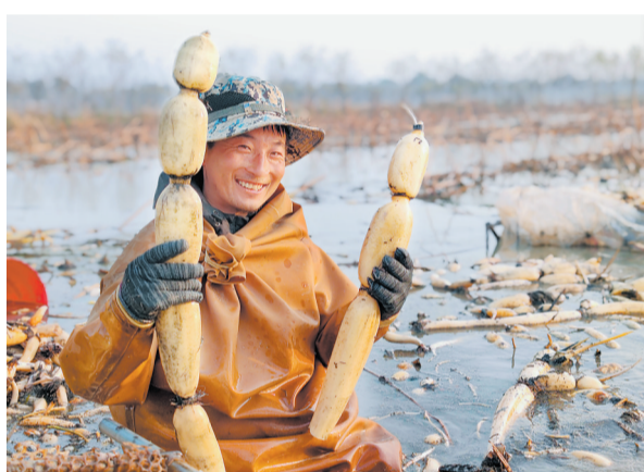
手持莲藕,再累也是幸福的