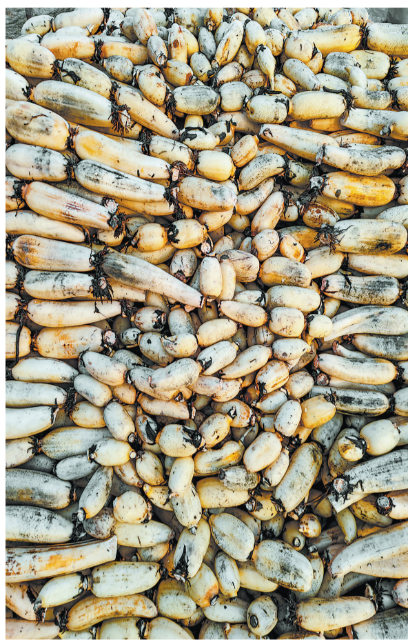
丰收的莲藕堆成山