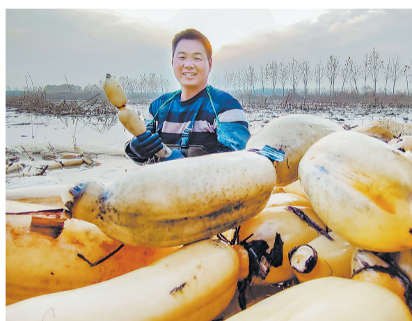
丰收的喜悦洋溢在脸上