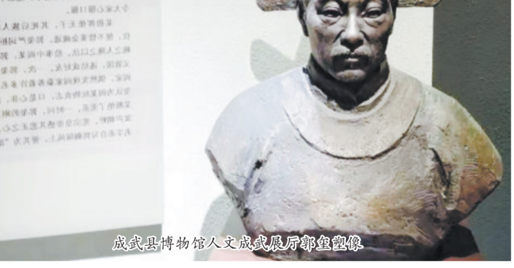
成武县博物馆人文成武展厅郭玺塑像

政之事。原来门达统率的锦衣卫恣意妄为,李贤多次向皇帝上书,英宗便“召达诫谕之”。新皇登基,门达便勾结王纶,欲除掉李贤。事情败露,宪宗大怒,结果王纶被斩,钱溥被贬,门达“论斩系狱”。在此情况下,郭玺要求离开,李贤大概认为郭玺不支持自己,所以非常恼怒,就把郭玺派到了工部担任营缮主事。 郭玺办事严谨,两袖清风。但工部下属监局的官吏,因与当朝权贵省有牵连,一贯无所畏惧,公然与工部主事分庭抗礼。郭玺刚走马上任,监局就有人从中作梗,给他使下马威,郭玺抓住一个小官吏“执而答之”。由于郭玺敢于碰硬,毫不姑息,最终使监局官吏偃旗息鼓,俯首贴耳。大宦官黄顺深得皇帝宠信,他让人家找郭玺办私事,被郭玺训斥。黄顺怀恨在心,亲自把家人的两根手指折断,然后向皇帝面奏郭玺“侵削酷暴”,致使郭玺被逮捕入狱。当时,有很多人认为他大难临头,在劫难逃,但郭玺却谈笑风生,泰然自若。皇帝又令人抄了郭玺的家,结果只抄到一些书籍、破箱子及旧衣物,无一像样值钱的东西。皇帝见郭玺如此清贫,非常震惊,怒斥黄顺说:“你说郭玺贪污残暴,是诬陷!”一怒之下将黄顺贬到南京,加升郭玺为兵部武库主事。此时,恰巧兵部员外郎一职出现空缺,吏部一致认为非铁腕之人不能担当此任,于是便由郭玺升补。郭玺刚柔并济,为人处事严谨,对于