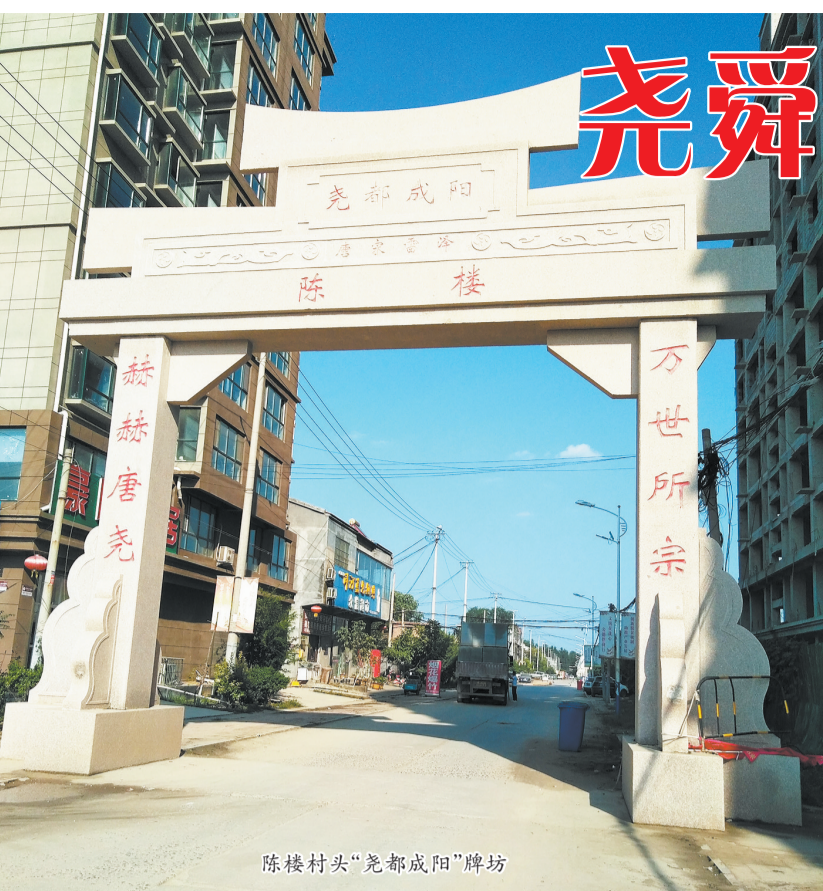
陈楼村头“尧都成阳”牌坊

2013年11月,习近平主席来菏泽考察,在讲话中曾说到,菏泽是“伏羲之桑梓,尧舜之故里”,这里就不得不提“成阳故城”,因为“成阳故城”就是尧舜的故里。成阳故城遗址位于菏泽城东北约25公里的牡丹区胡集镇,在上世纪六十年代兴修水利工程时,遗址就被发现。后经文物部门勘探认定,成阳故城最初应为尧舜禹时代的都城。