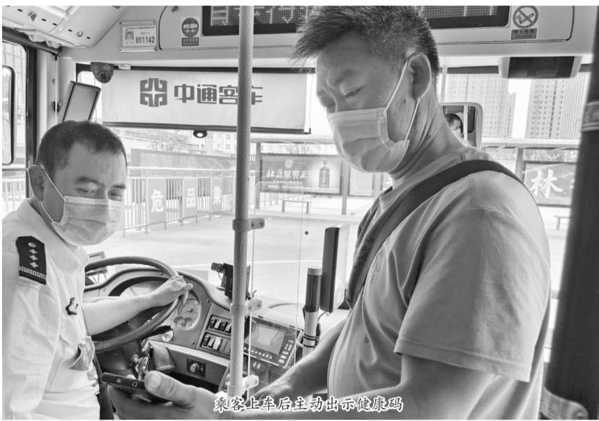
乘客上车后主动出示健康码

菏泽公交集团全员接种新冠疫苗,城际公交驾驶员上岗前体温检测,汽车总站谢绝中高风险地区返回乘客