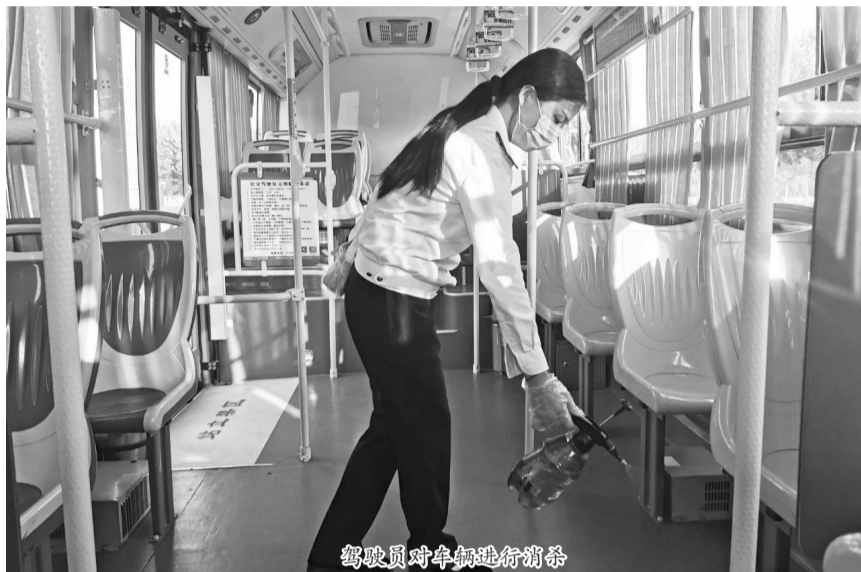
驾驶员对车辆进行消毒