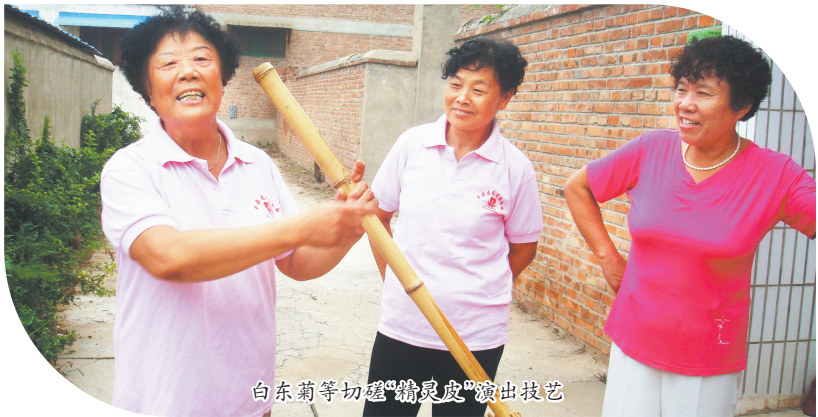
白东菊等切磋“精灵皮”演出技艺