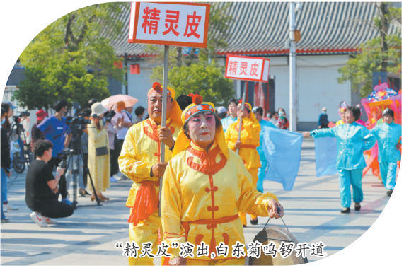
“精灵皮”演出,白东菊鸣锣开道