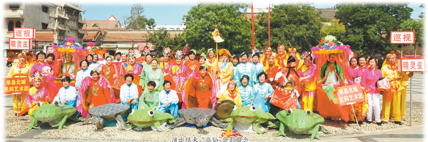
演出结束,“众仙”合影留念