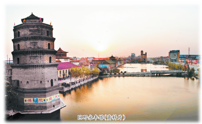
巨野永丰塔(资料图)

内涵,五大主导文化产业,两大核心产业品牌,“三大文化园区一大基地”等一系列文化产业规划正逐步实施。 巨野县用历史文化丰富城市建设内涵,重点打造“千年麟城,吉祥巨野”的形象品牌。突出抓好“麒麟文化”“人祖文化”建设,搞好麒麟文化研究,全力搞好麒麟文化园建设,把中华麒麟园建设成4A级景区,发展吉祥文化;以蚩尤墓为依托,规划建设蚩尤大殿,集华夏民族先圣祭祀、中国早期文明为一体,发展中华祖先文化。