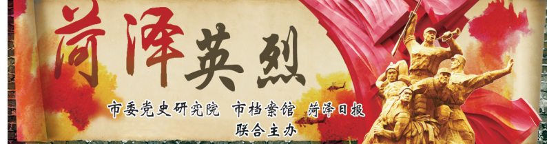
菏泽英烈 市委党史研究院 市档案馆 菏泽日报 联合主办

说，过去没有人知道。其中就有（周文王）训：“……昔舜旧作小人，亲耕于历丘。”这样的表述，意思是“从前，虞舜还是平民百姓的时候，亲力耕作于历丘这个地方。”除菏泽市鄄城县的历山外，遍查《辞海》其他六个地方的历山，都没有叫过历丘这个名字，而且，他们的地域内也根本没有这样众多叫作“丘”的地名。由此可见，历丘这个称呼在典籍中是事实存在的，也就是说，唯一和舜有关系的这个历丘就是专指鄄城县的历丘，而且，最早，这个名字也是叫作历丘。